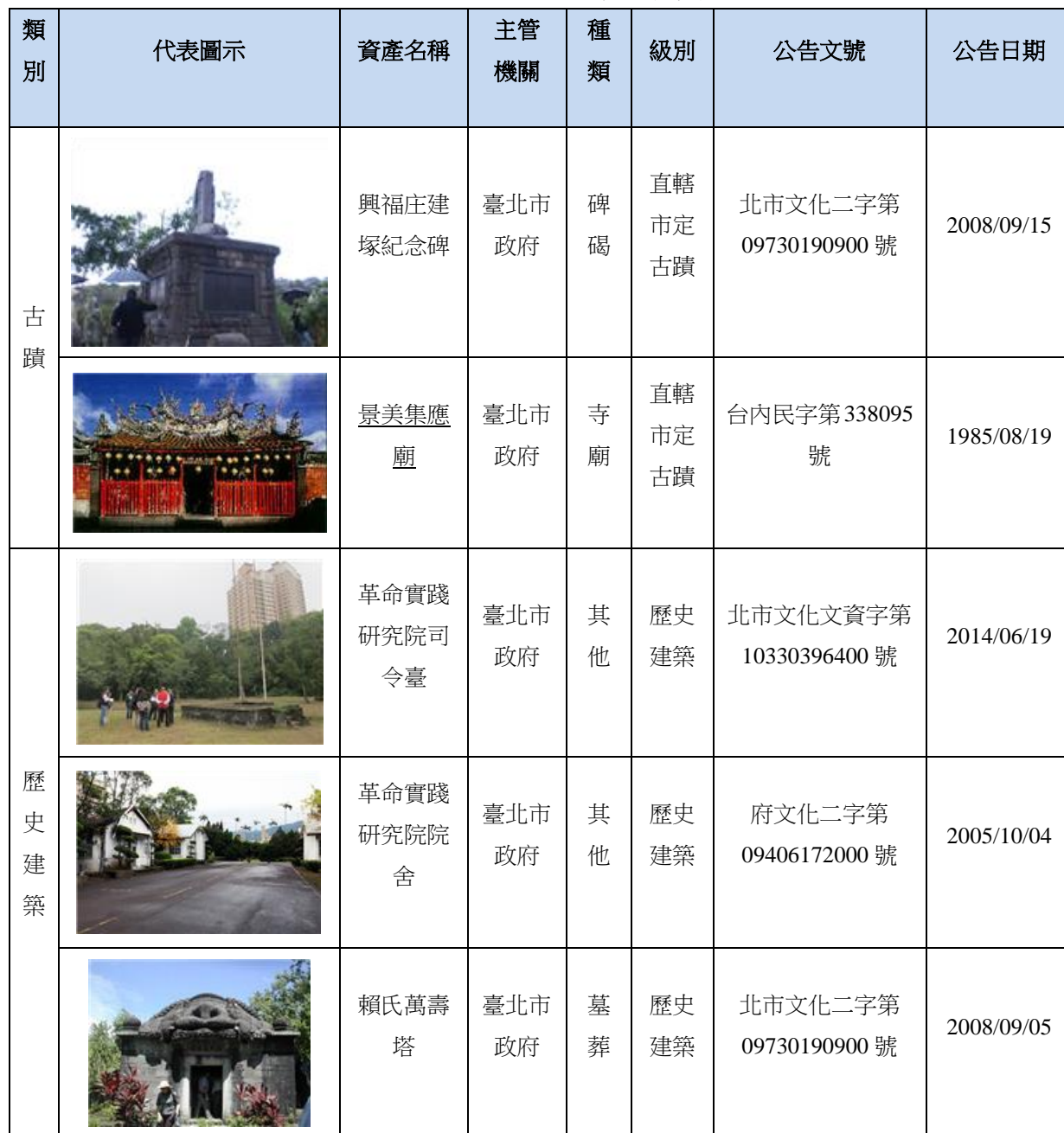
表二 台北市文山區有形文化資產表

根據文化部文化資產局提供的資料，文山區目前經指定、登錄之有形文化資產共有 7 項，市定古蹟 2 項，歷史建築 2 項，文化景觀 1 項，古物 1 項；無形文化資產則有 1 項（表二、表三）。