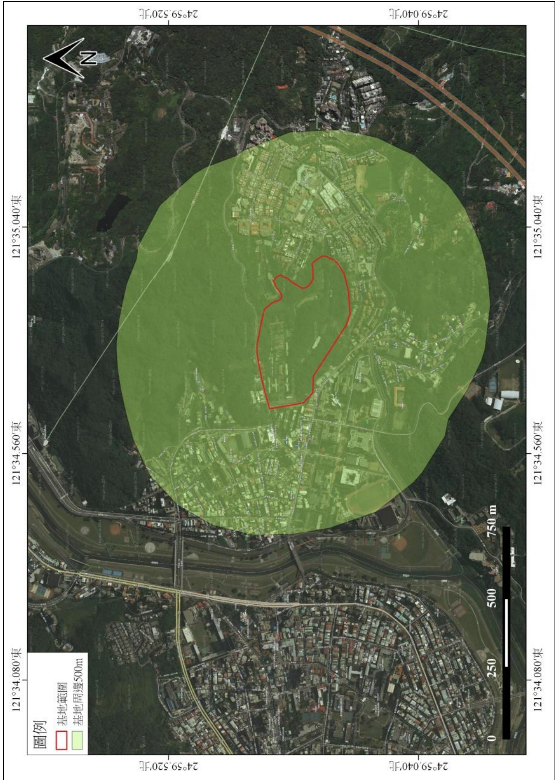
圖 2 基地與周邊 500 公尺範圍