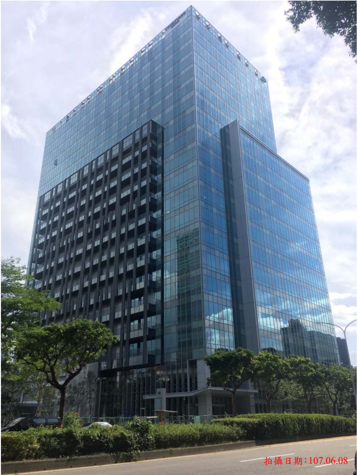
圖 3-2 開發基地周圍現況照