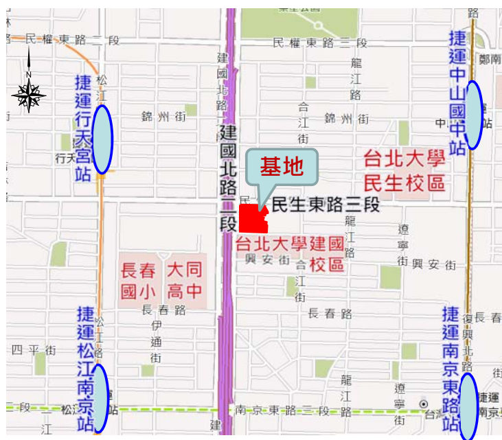
本計畫開發基地位置圖