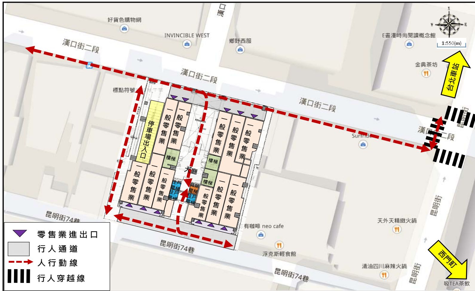
圖2.2-1 基地平面配置及動線圖(地圖比例：1/550)