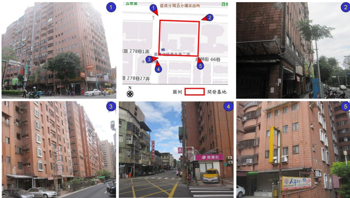
圖 3-2 開發基地周圍現況照