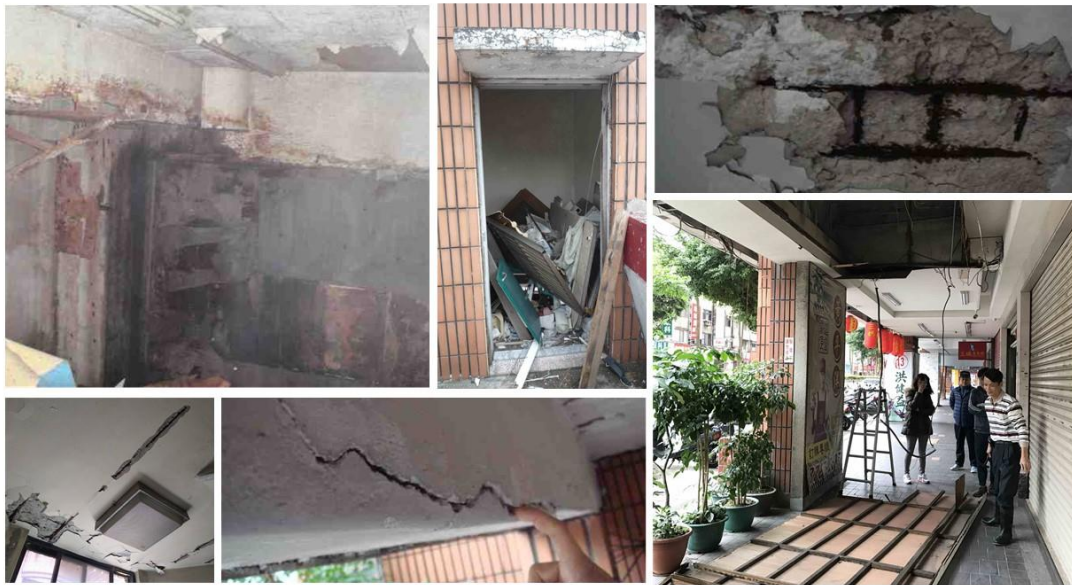
圖 3-3 開發基地內部現況照