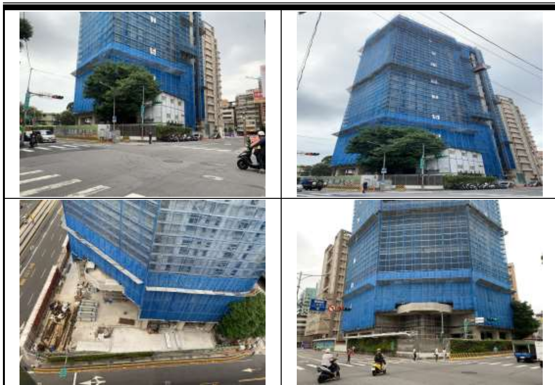
圖 3-3 基地現況照片