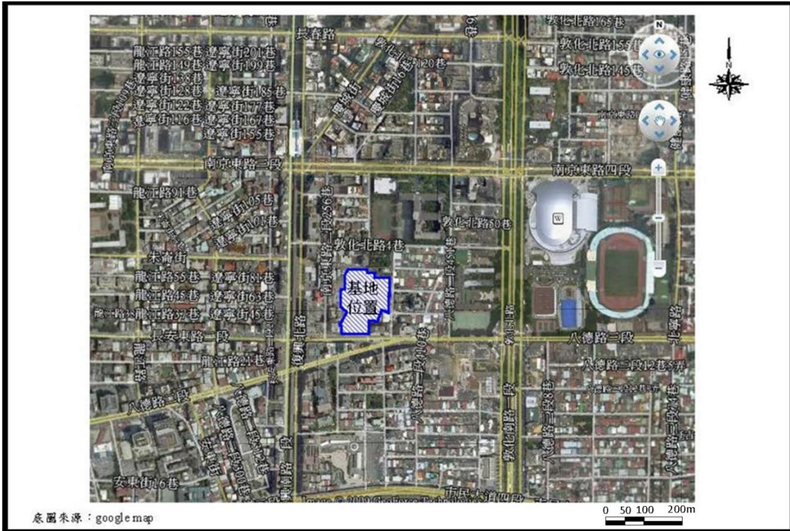
圖 3-1 開發基地位置