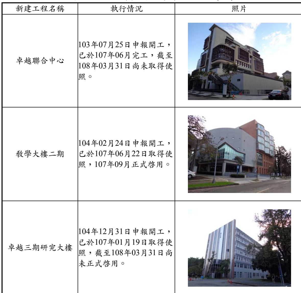
表3.1-1 本計畫開發行為現況說明(1/2)

本計畫「國立臺灣大學校總區之教學大樓二期等七件新建工程環境影響說明書」前於民國102年07月09日環署綜字第1020058538E號公告審查結論在案，卓越聯合中心、教學大樓二期、卓越三期研究大樓、生物電子資訊教學研究大樓、教學大樓停車場及工學院綜合新館新建工程於103年07月25日起陸續進入施工階段，截至108年03月為止，僅教學大樓二期於107年09月正式啓用，卓越聯合中心、卓越三期研究大樓、教學大樓停車場已完工尚未啓用，生物電子資訊教學研究大樓及工學院綜合新館尚屬施工階段，如表3.1-1所示。