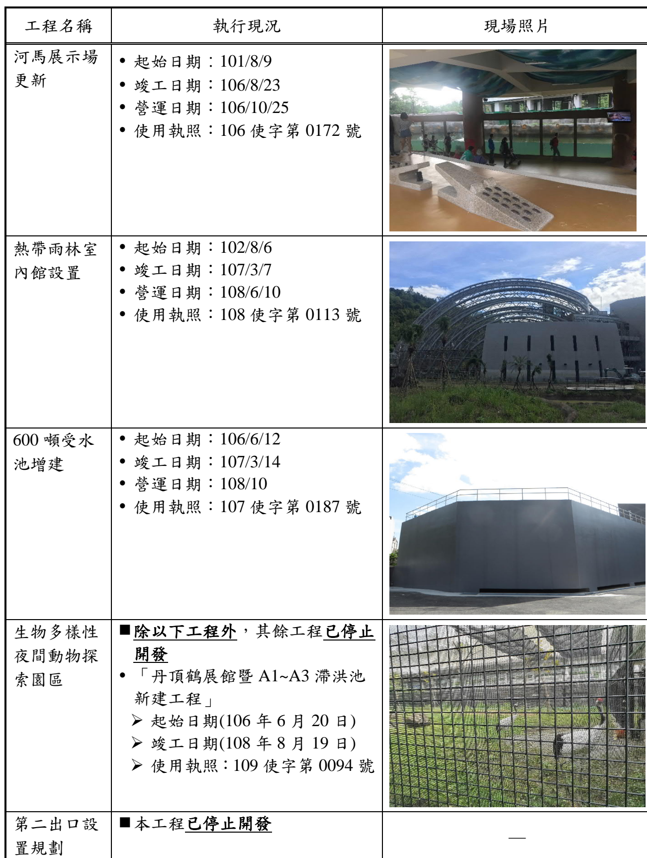
表 3-1 本開發計畫執行現況一覽表