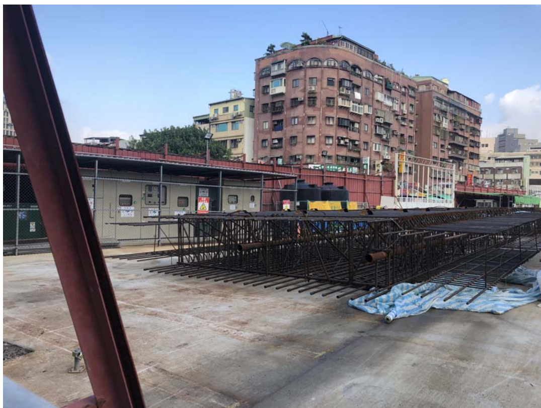
基地現已完成連續壁施作，尚未進行地下室開挖