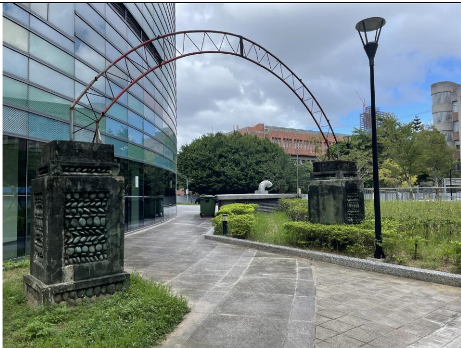
圖版 8：下內埔營舍營區入口門柱之現況