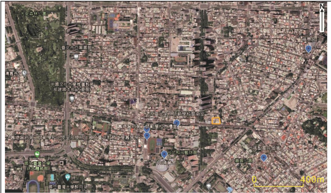
圖 3：本開發基地 1 公里範圍內之文化資產分布位置圖