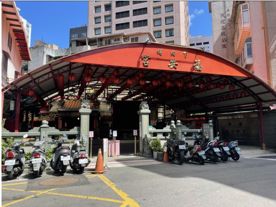
圖版 11：大安區福安宮保儀大夫保儀尊王聖駕過頭下內埔庄遠境，未來應審慎注意 施工路線避免造成廟宇繞境與暗訪等廟慶活動之進行