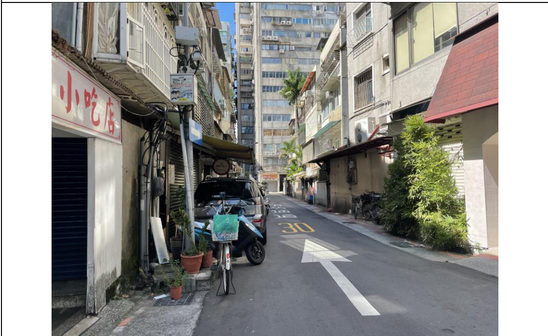
圖版 2：基地範圍北側之安和路二段 184 巷現況