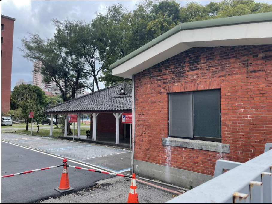
圖版 7：舊總督府第二師範學校小使室及便所（國立臺北教育大學舊琴房）之現況