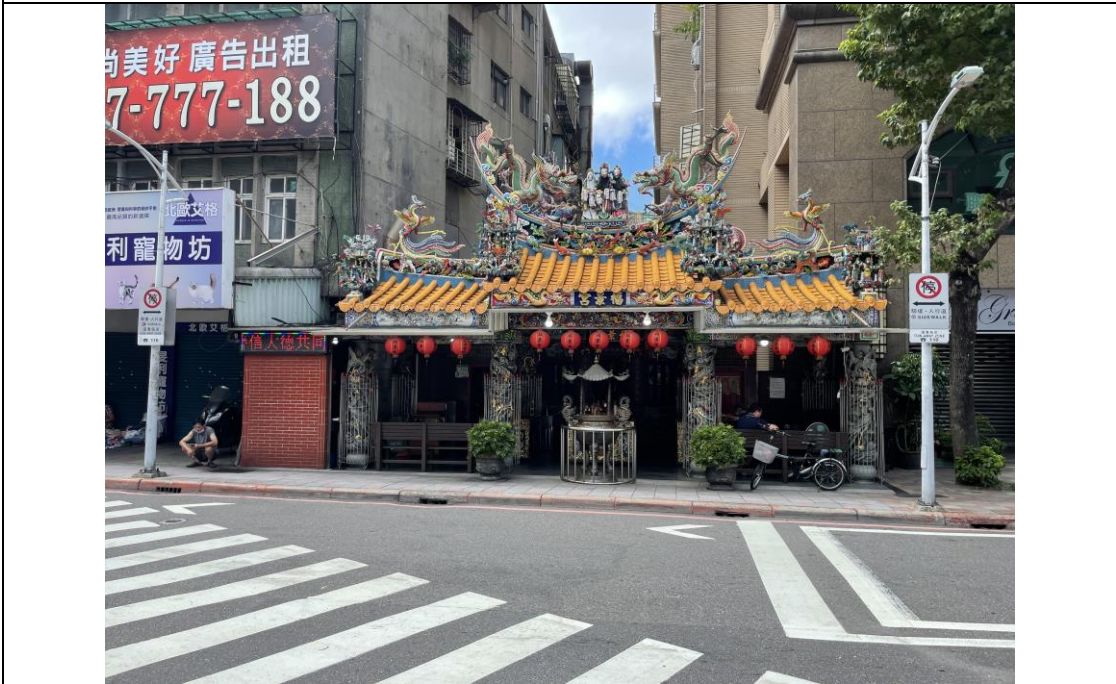
圖版 10：臺北市福景宮之現況