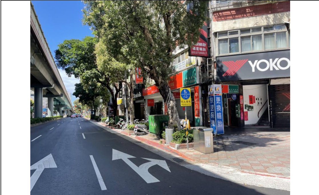
圖版 1：基地範圍南側之和平東路三段現況