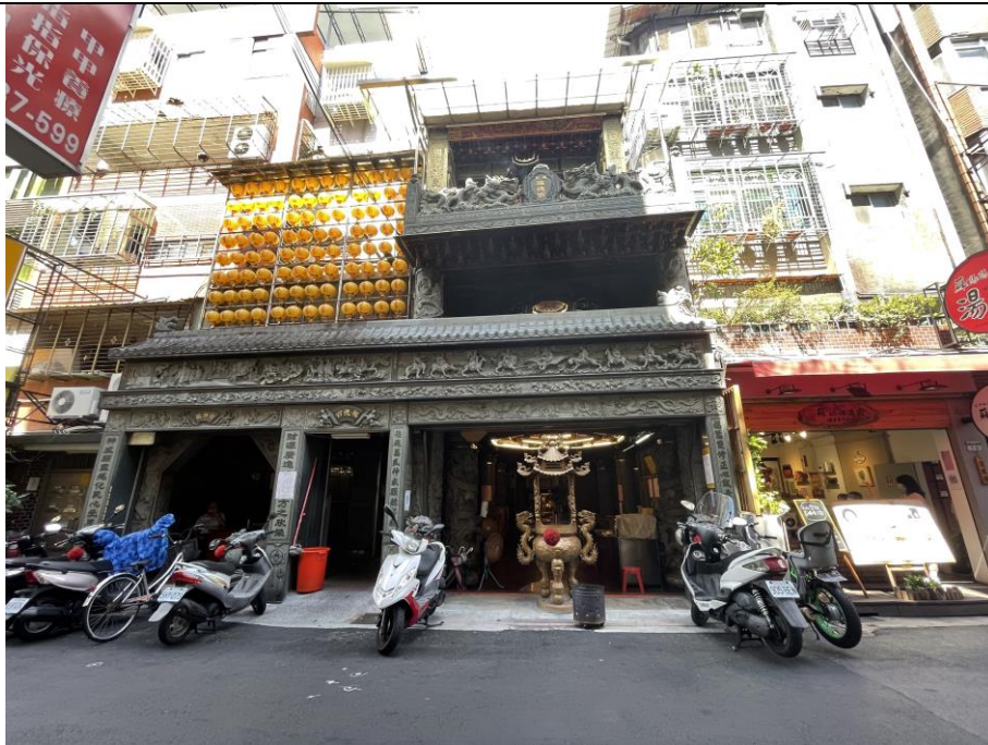
圖版 12：通化福德宮之現況