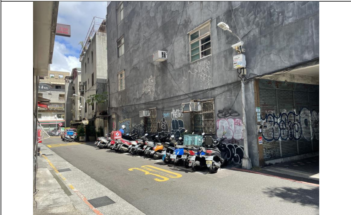
圖版 4：基地範圍西側之和平東路三段 67 巷現況