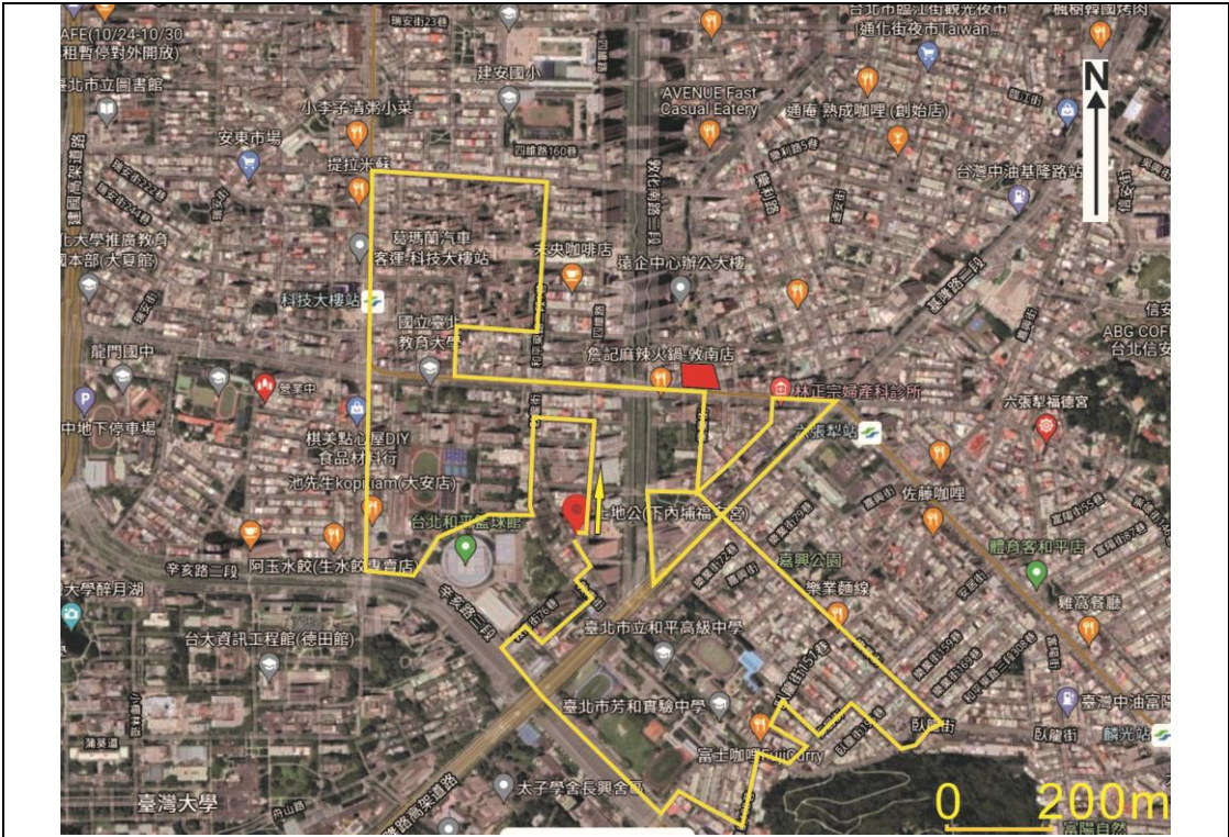
圖 2：大安區福安宮保儀大夫保儀尊王聖駕過頭下內埔庄遶境路線 （紅色方框處為本計畫基地，黃色箭頭處為下內埔福安宮繞境起點， 本圖底圖為 Google map，本計畫修改之）