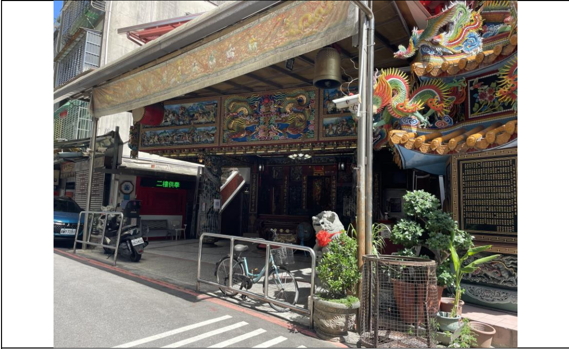
圖版 13：文昌街三聖宮之現況