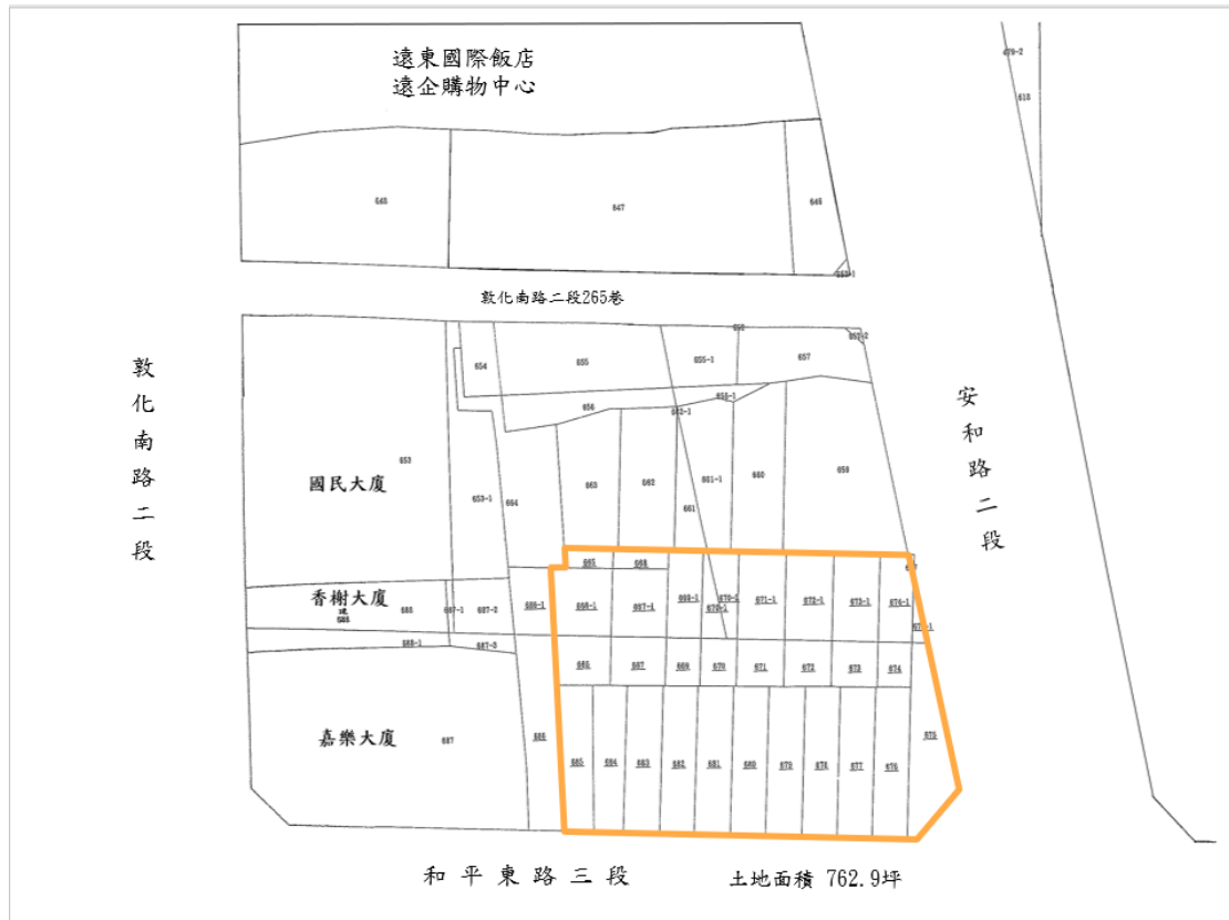
圖 1：本開發基地範圍圖