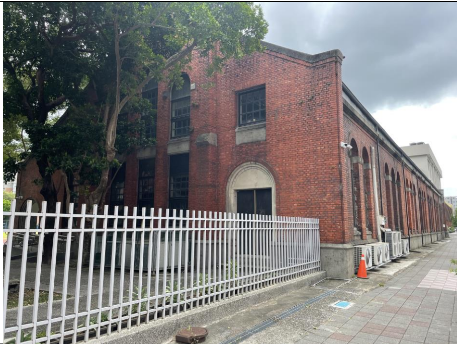
圖版 6：舊總督府第二師範學校大禮堂（國立臺北教育大學舊禮堂）之現況