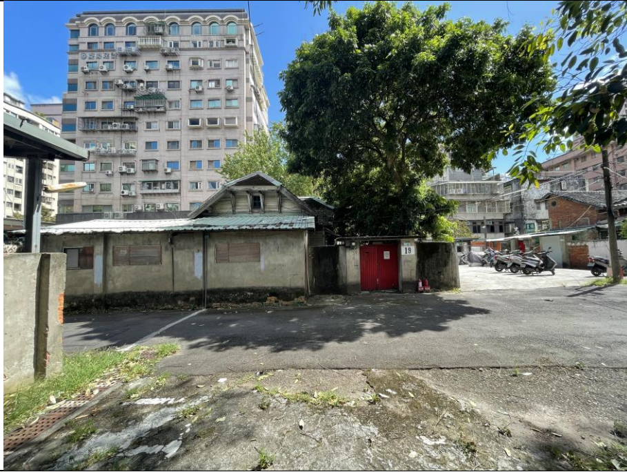
圖版 5：原臺北第二師範學校警衛室之現況