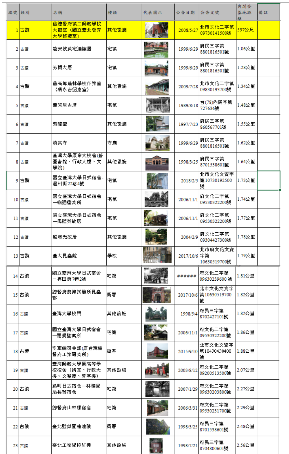
表 1：大同區文化資產一覽表（反黃部分為距離本計畫開發基地範圍 1 公里內）