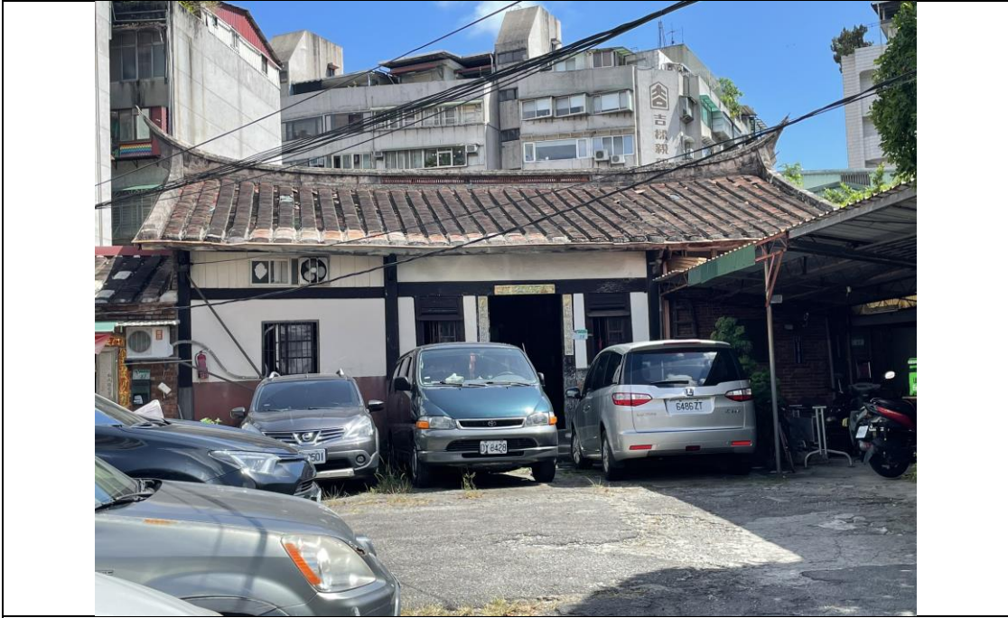
圖版 9：六張犁高氏古厝之現況