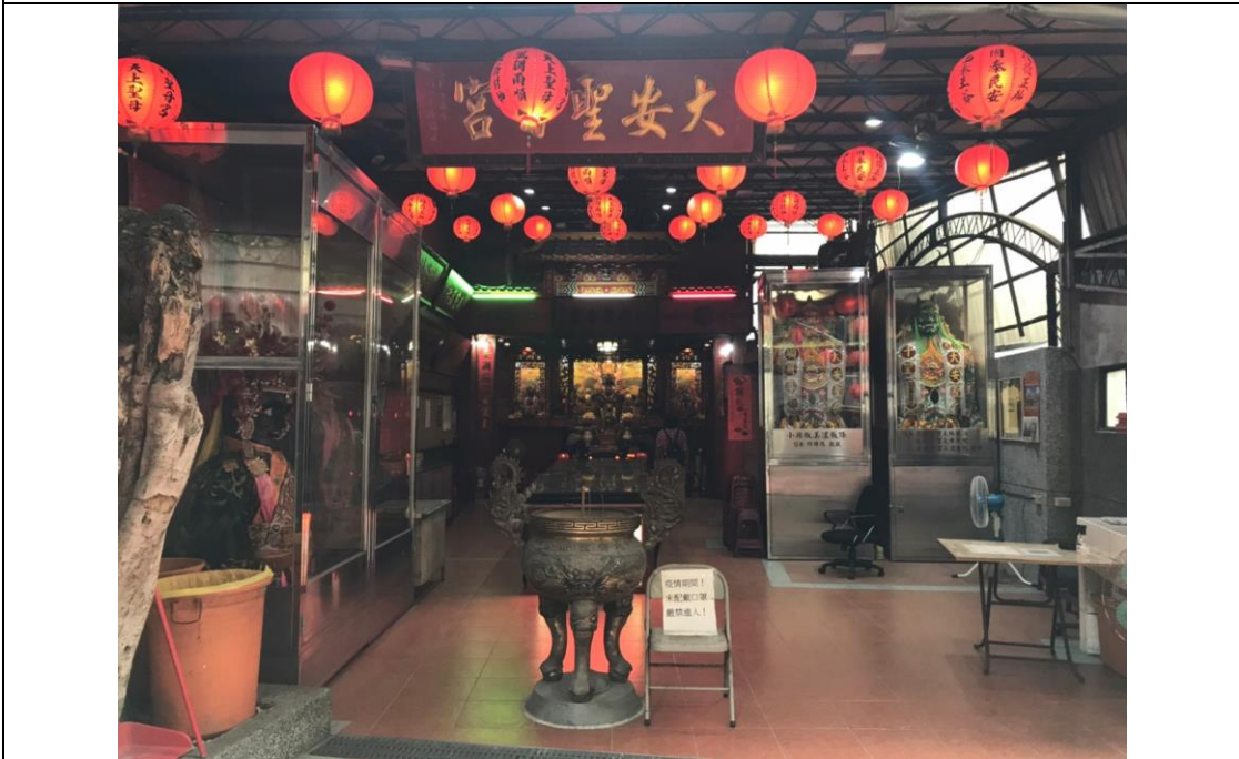
圖版 13：大安聖母宮之現況