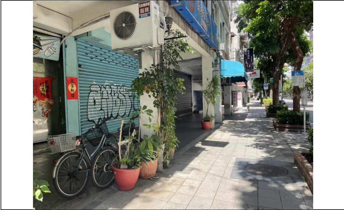
圖版 3：基地範圍東側之安和路二段現況