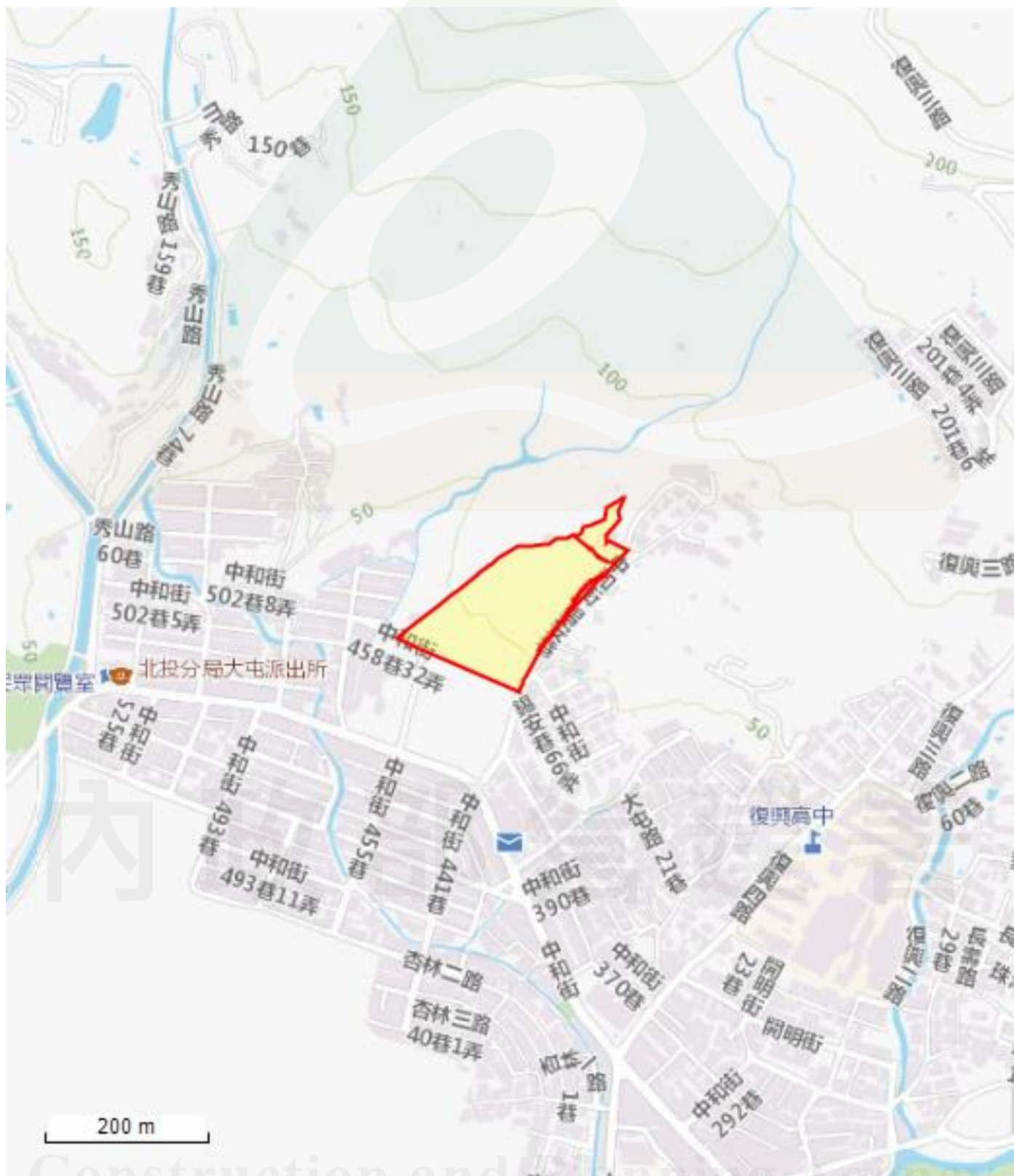
附表1 申請查詢範圍位置圖