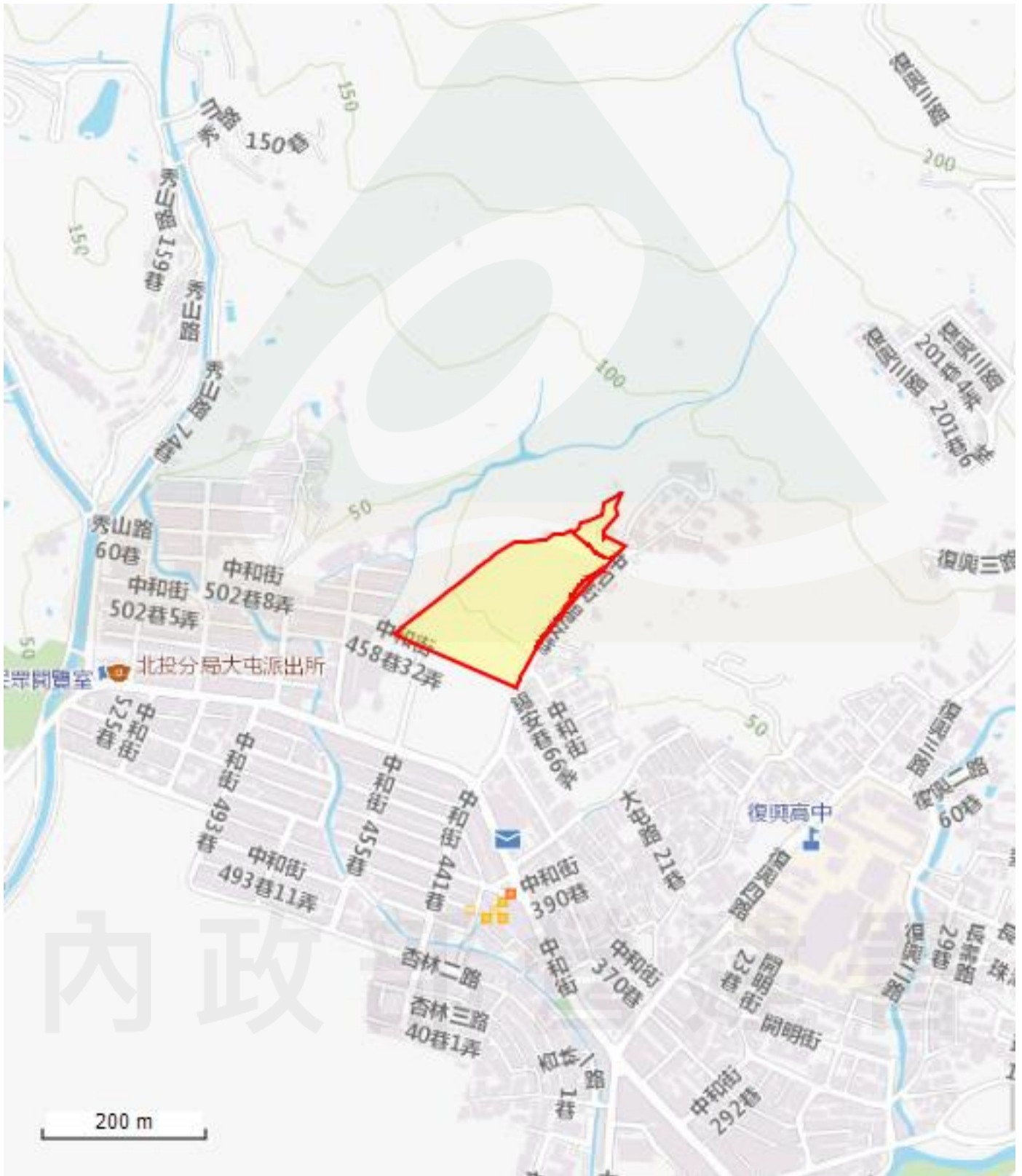
環境敏感圖資：淹水潛勢，申請案件位置圖