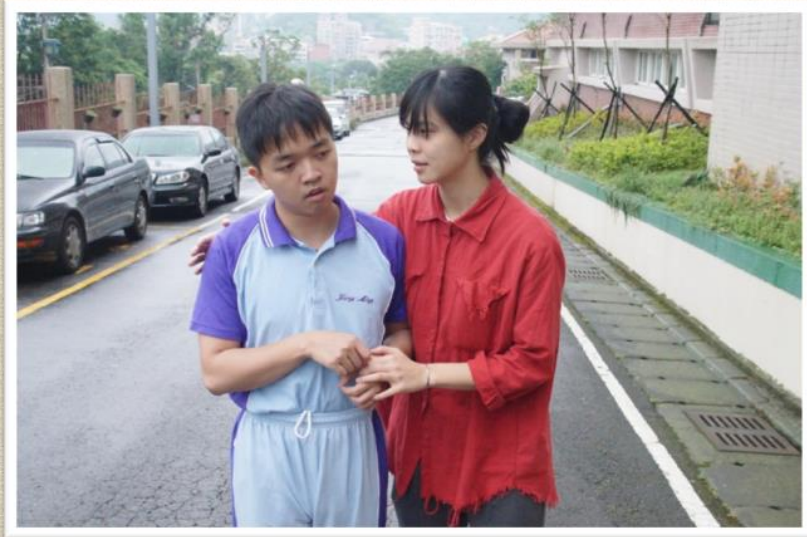
臺北市立陽明教養院