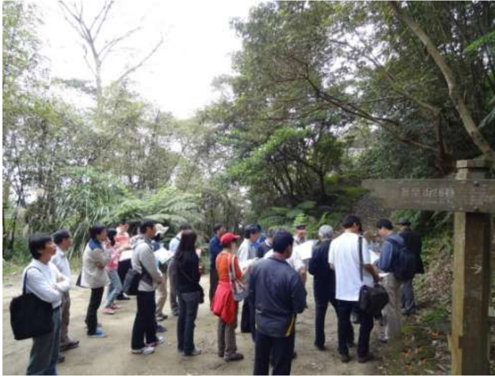
▲都市計畫案專案小組現地會勘