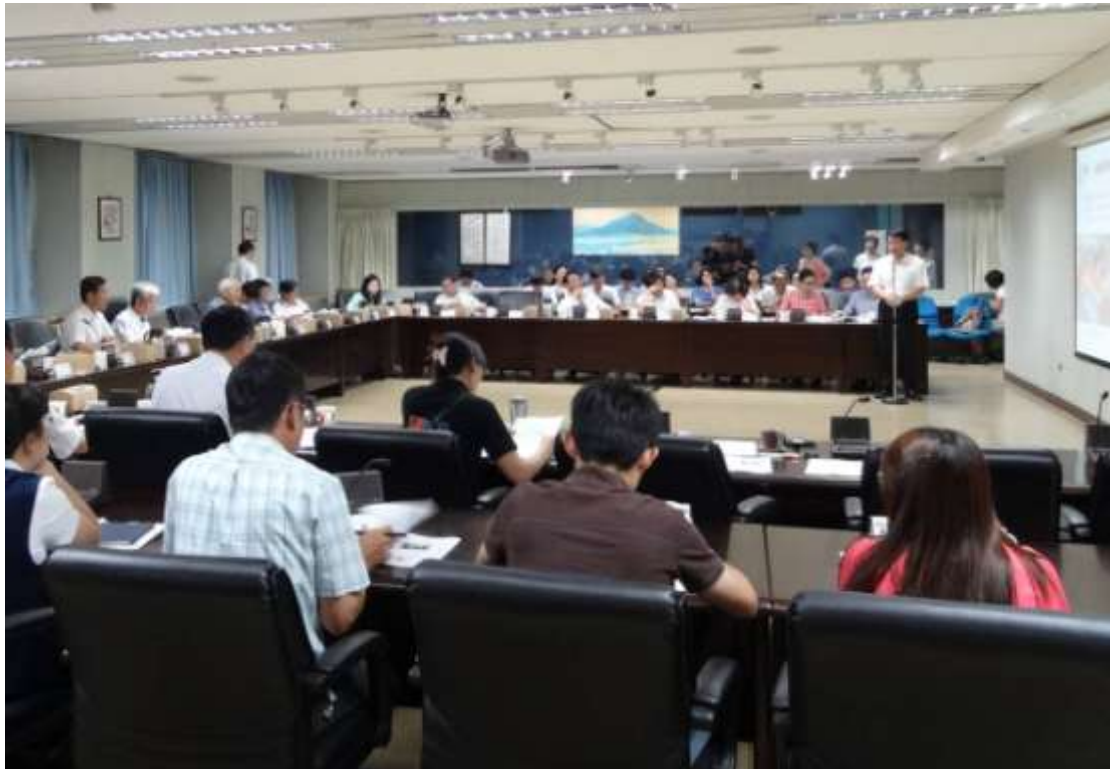
▲委員會議開會情形

次委員會議，為配合審議效率，必要時則增開會議。102 年 1 至 6 月共召開都市計畫委員會議 5 次，計報告案 5 案、審議都市計畫案 17 案次（含再提會審議）、研議案 1 案（詳如附件 1、2、3）。