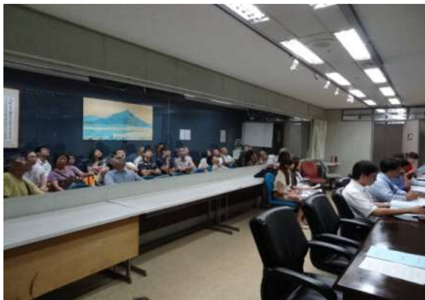
▲委員會議室旁設置旁聽室供民眾旁聽

除了將陳情意見彙整提供委員參考外，本會自 77 年起即朝公開化、透明化方向努力，於本會召開審議會議（含全體委員會議及專案小組會議）前，即以書面通知議案內之陳情民眾、團體和機關於議場旁之旁聽室同步觀聽會議之進行。另為能維護會議之會場秩序，掌握審議品質與效率，特訂定「臺北市都市計畫委員會都市計畫審議旁聽及登記發言注意事項」(附件 4)，提 100 年 7 月 28 日本會第 626 次委員會報告後實施。相關會議召開時，陳情者可依前開注意事項，登記進場發言表達意見，提供委員審議參考。