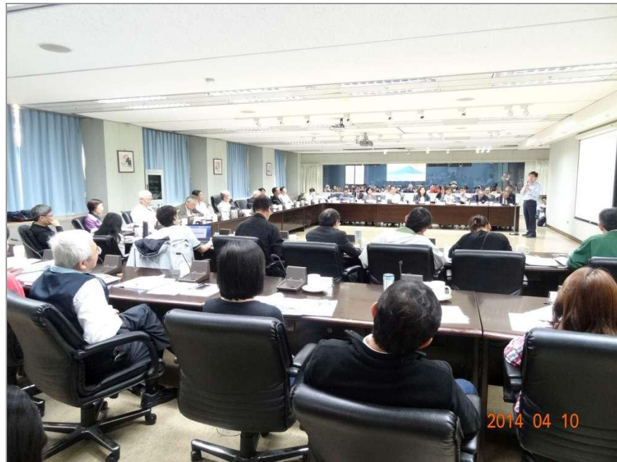
▲委員會議開會情形

(5) 包括「變更臺北市大安區學府段一小段 62 地號等 19 筆土地第三種住宅區為第三種住宅區（特）暨修訂第三種商業區（特）土地使用分區管制細部計畫案」等共 3 處「臺北市老舊中低層建築社區辦理都市更新擴大協助專案計畫」之都市計畫變更案。