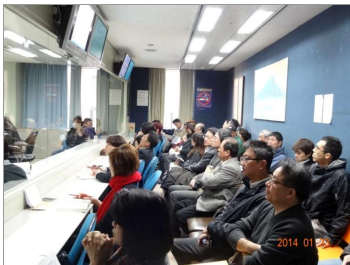
▲委員會議室旁設置旁聽室供民眾旁聽

除了將陳情意見彙整提供委員參考外，本會自 77 年起即朝公開化、透明化方向努力，於本會召開審議會會議（含全體委員會議及專案小組會議）前，即以書面通知議案內之陳情民眾、團體和機關於議場旁之旁聽室同步觀聽會議之進行。另為能維護會議之會場秩序，掌握審議品質與效率，特訂定「臺北市都市計畫委員會都市計畫審議旁聽及登記發言注意事項」(附件 3)，提 100 年 7 月 28 日本會第 626 次委員會報告後實施。相關會議召開時，陳情者可依前開注意事項，登場發言表達意見，提供委員審議參考。