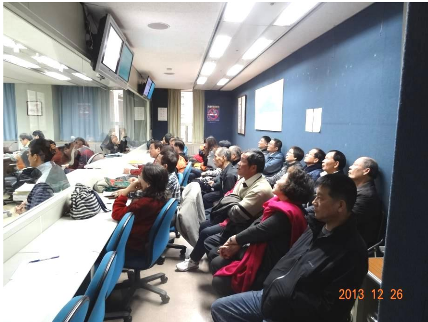
▲委員會議室旁設置旁聽室供民眾旁聽

序，掌握審議品質與效率，特訂定「臺北市都市計畫委員會都市計畫審議旁聽及登記發言注意事項」(附件4)，提100年7月28日本會第626次委員會報告後實施。相關會議召開時，陳情者可依前開注意事項，登場發言表達意見，提供委員審議參考。