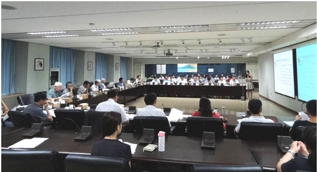
▲委員會議開會情形

(4) 另審議通過包括「變更臺北市大安區仁愛段四小段192地號等13筆土地第四種住宅區為第四種住宅區（特）細部計畫案」等共7處「臺北市老舊中低層建築社區辦理都市更新擴大協助專案計畫」之都市計畫變更案。