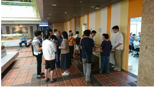
▲委員會議開會情形(民眾登記發言)