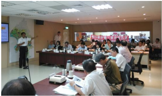
▲委員會議開會情形(聽取民眾發言)