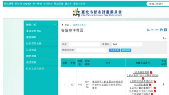
▲本會網站(審議案件專區)