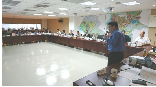
▲委員會議開會情形(申請單位簡報)