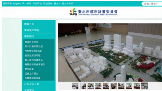
▲本會網站(最新消息)