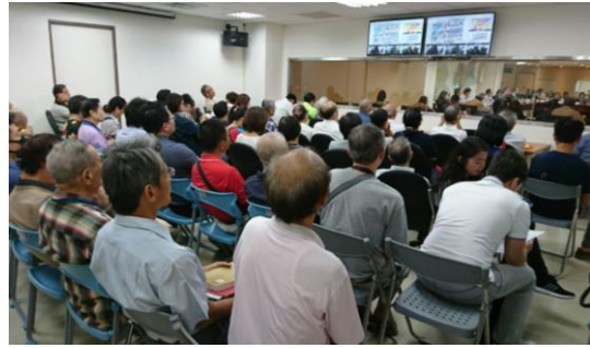
▲委員會議開會情形(旁聽室民眾)