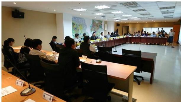
照片 3 都市計畫案專案小組開會情形