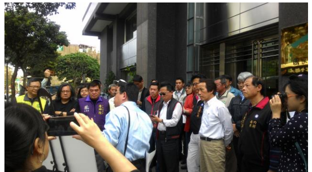
照片 4 都市計畫案專案小組現勘情形