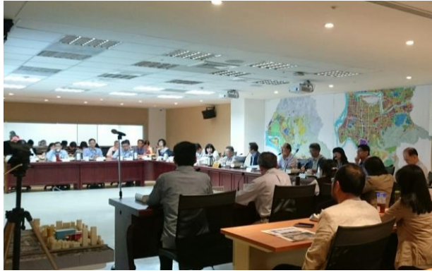
照片 1 委員會議開會情形（委員進行討論）