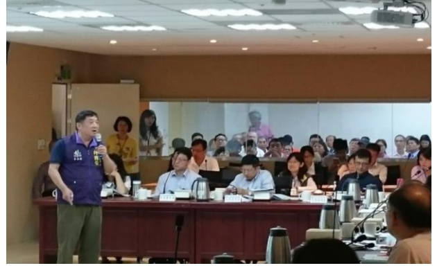
照片 2 委員會議開會情形（民眾進場發言）