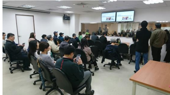
▲委員會議開會情形(旁聽室民眾)