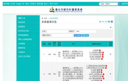
▲本會網站(委員會議專區)