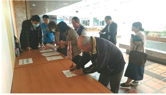
▲委員會議開會情形(民眾登記發言)