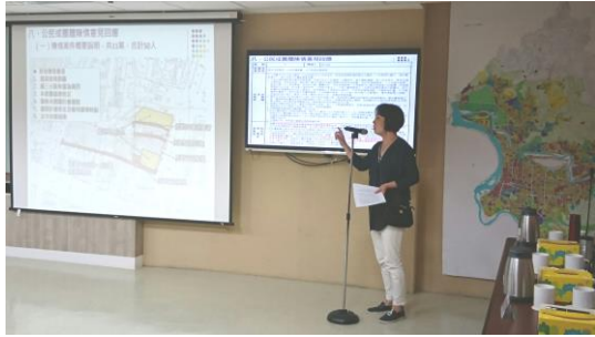
▲委員會議開會情形(聽取民眾發言)