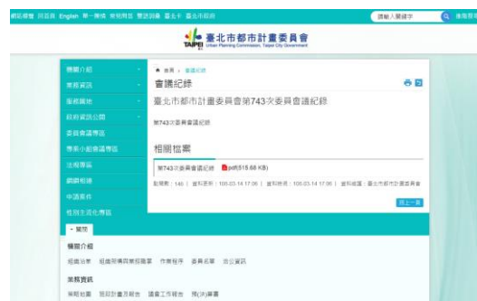
▲本會網站 (會議紀錄)