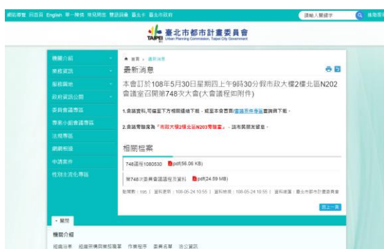
▲本會網站(最新消息)(會議訊息)

此外，針對每次委員會議紀錄，本會亦以會議召開後 8 日內公告於機關網頁為努力目標，期望讓民眾能透過網際網路，即可獲得完整的都市計畫審議資訊服務。