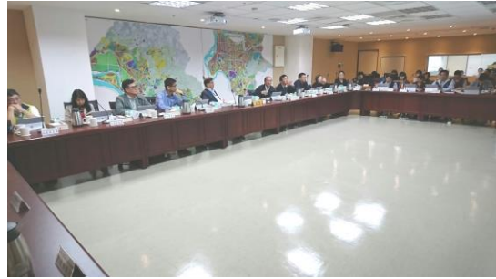
▲委員會議開會情形(委員討論)