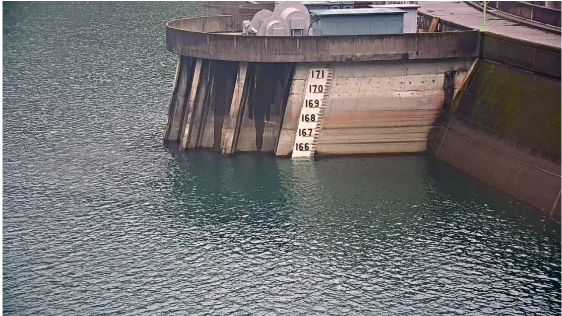
附圖 1：翡翠水庫 110 年 2 月 8 日水位現況照片