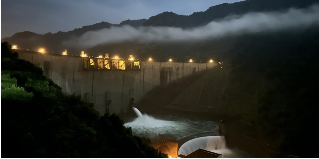
翡翠水庫支援供水至午夜凌晨