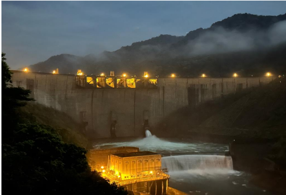
翡翠水庫支援供水至午夜凌晨