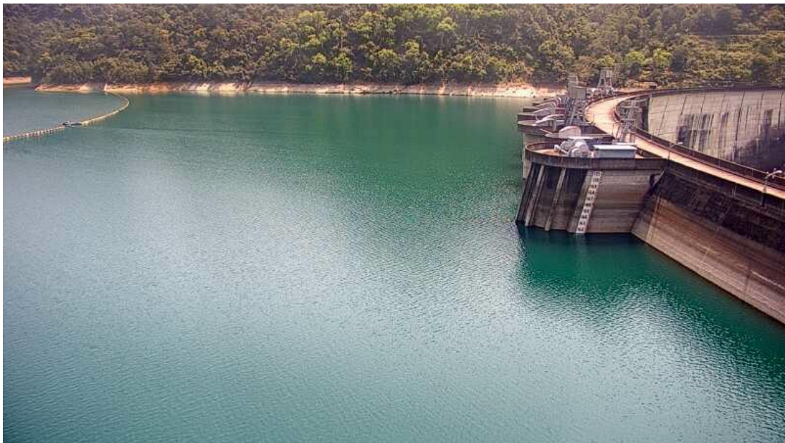
翡翠水庫目前有效蓄水率仍有 77%，蓄水量全台第一