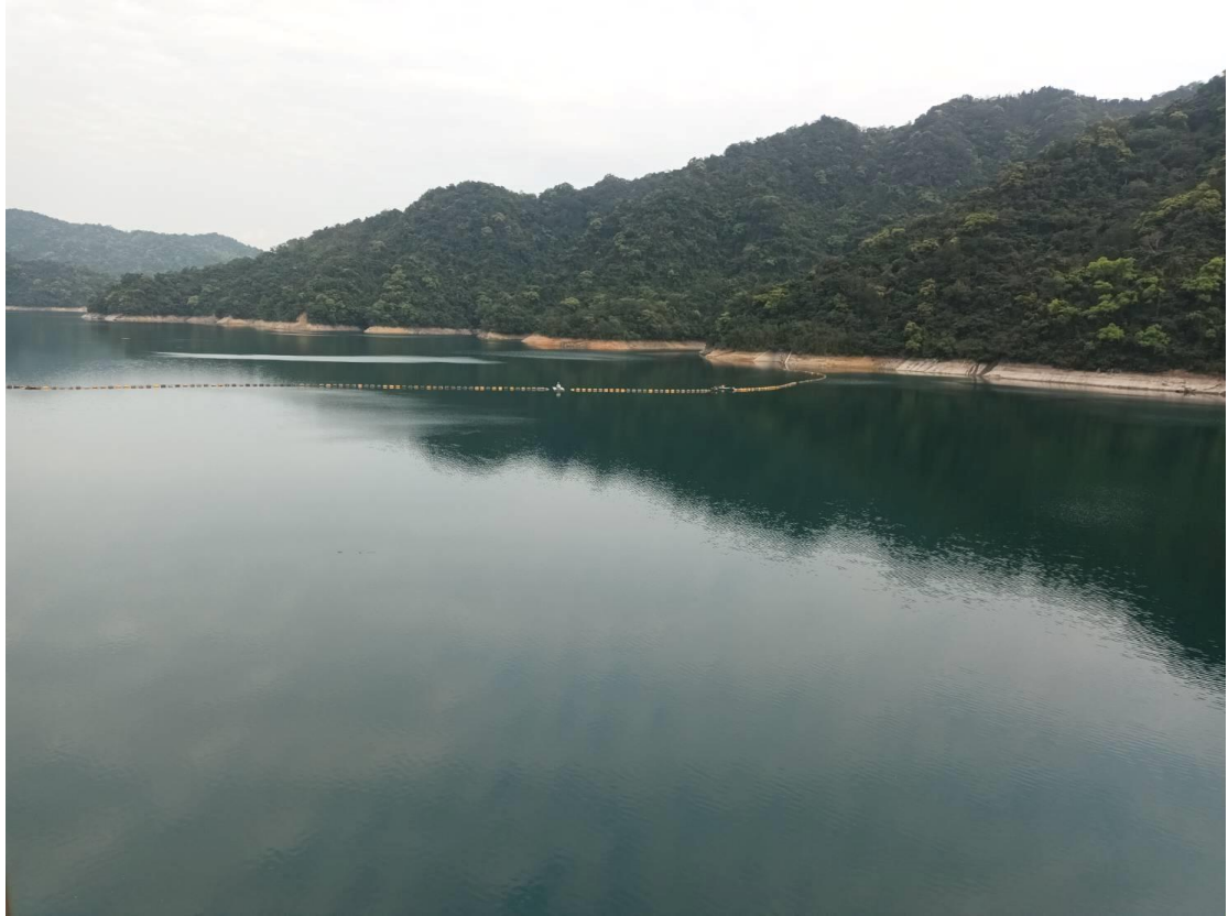
翡翠水庫目前蓄水正常