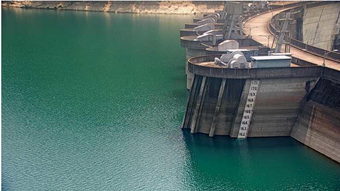
翡翠水庫目前蓄水率仍有 77%