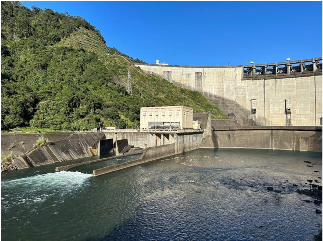
翡翠水庫平時供水，附帶水力發電，每年平均發電 2.2 億度