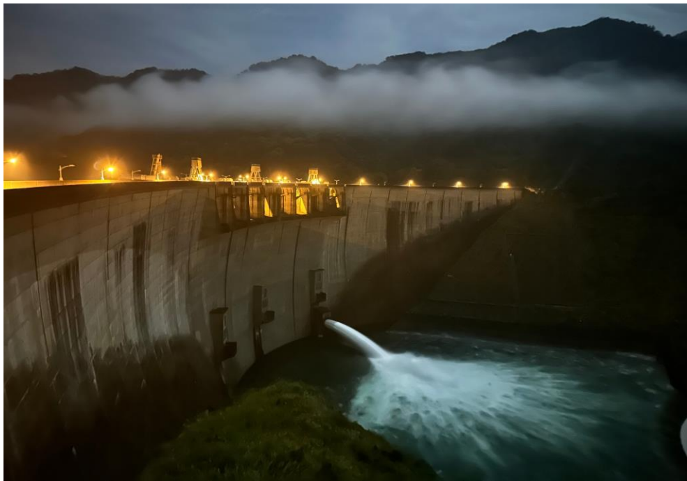
翡翠水庫支援供水至午夜凌晨