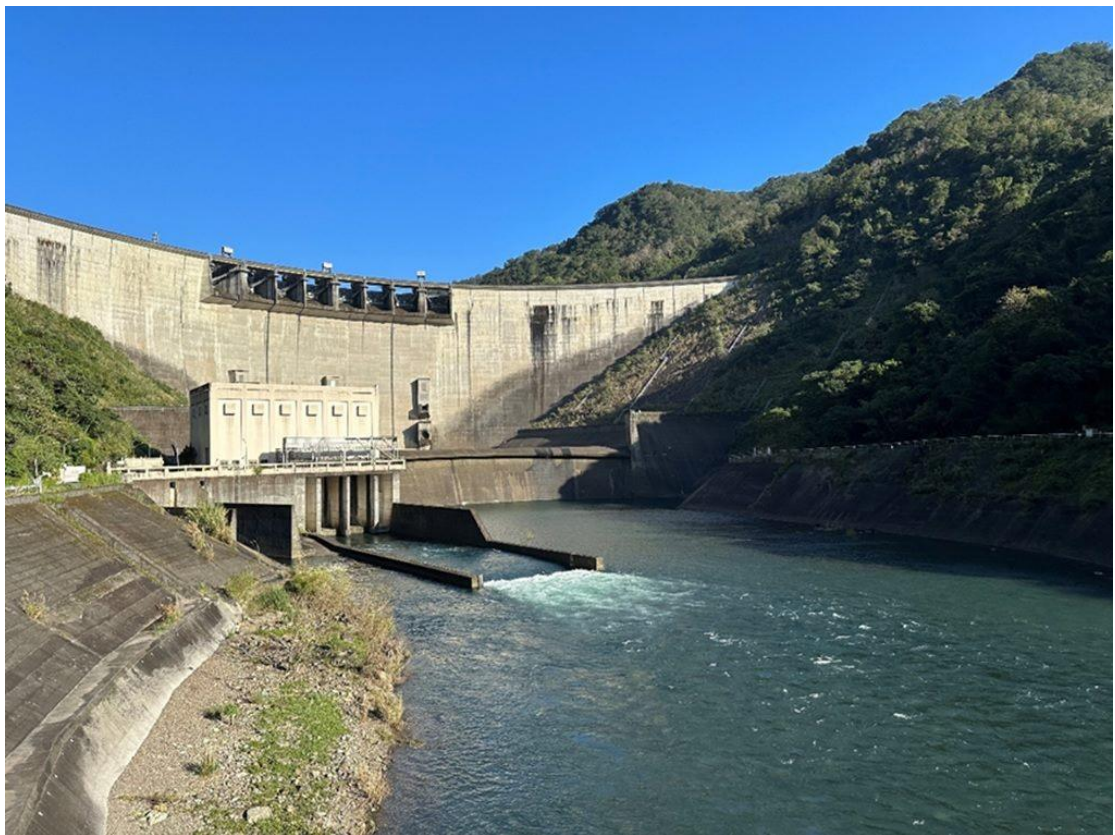
翡翠水庫平時供水，附帶水力發電，每年平均發電 2.2 億度