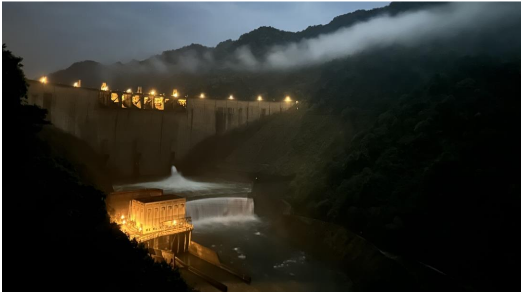
翡翠水庫支援供水至午夜凌晨