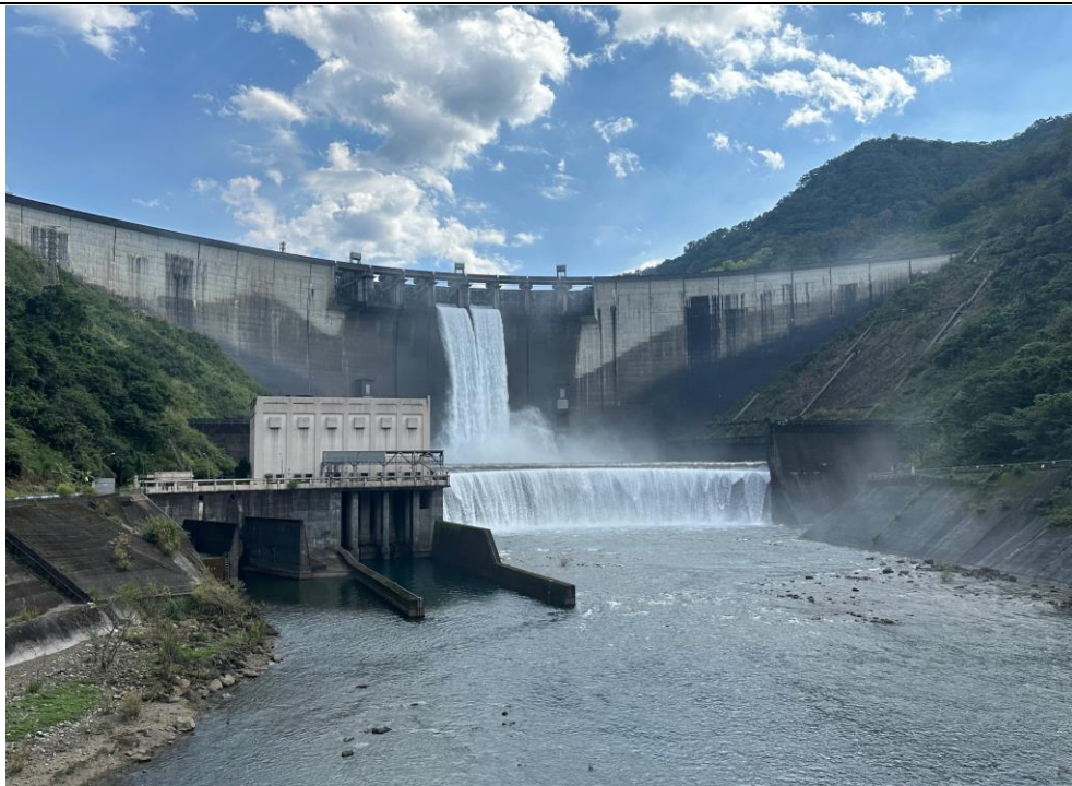
翡翠水庫「藍色療癒」水環境