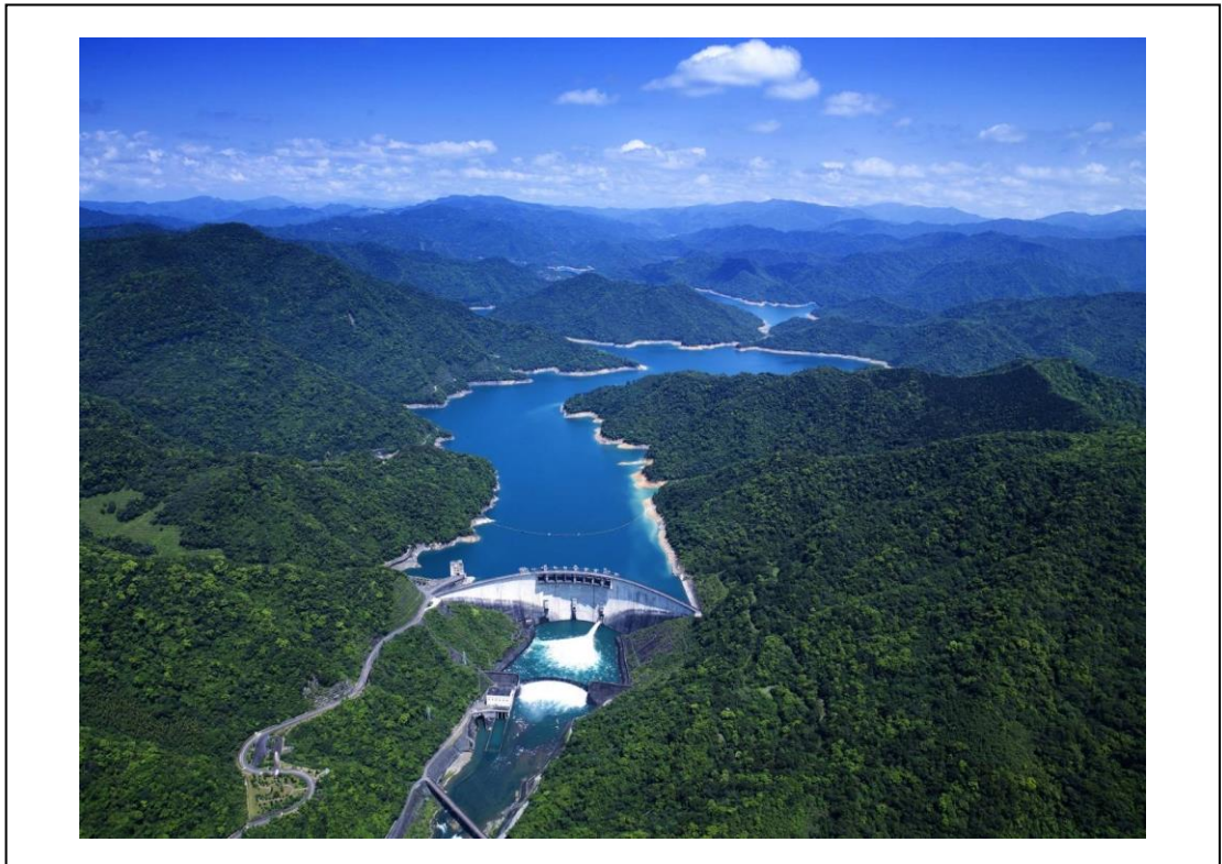
翡翠水庫「藍色療癒」水環境