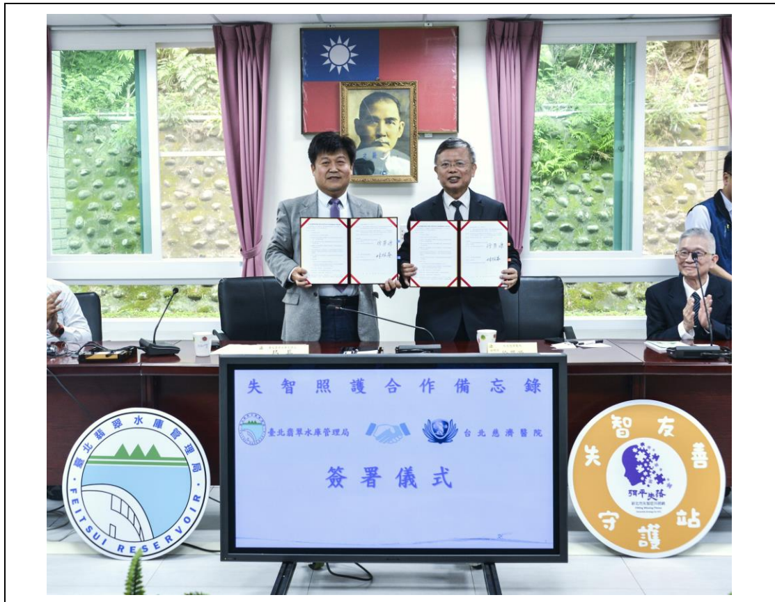
臺北翡翠水庫管理局今(8)日與臺北慈濟醫院 共同簽署「失智照護」合作備忘錄