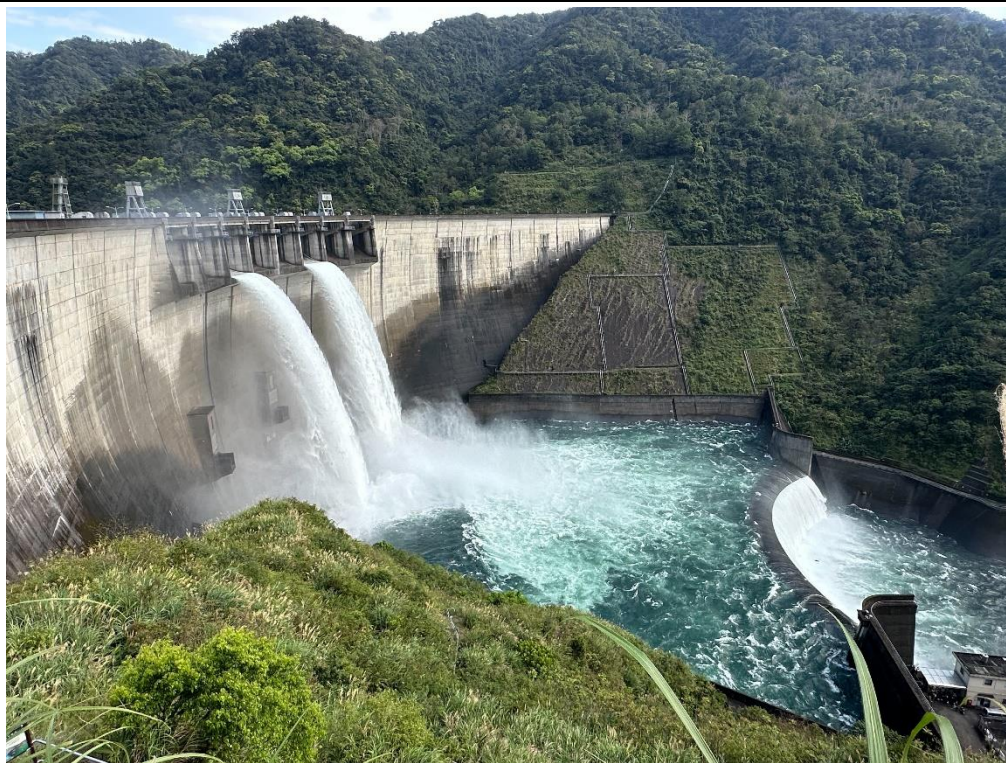
翡翠水庫「藍色療癒」水環境