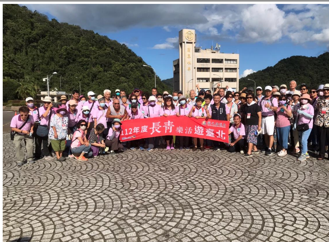
親近藍色水環境，有益身心健康！