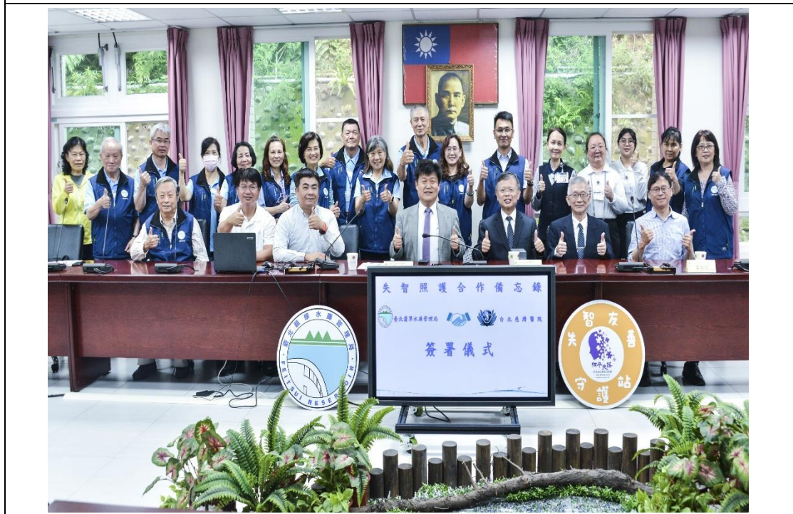
臺北翡翠水庫管理局今(8)日與臺北慈濟醫院 共同簽署「失智照護」合作備忘錄