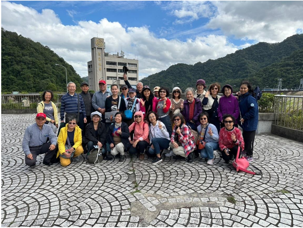
親近藍色水環境，有益身心健康！