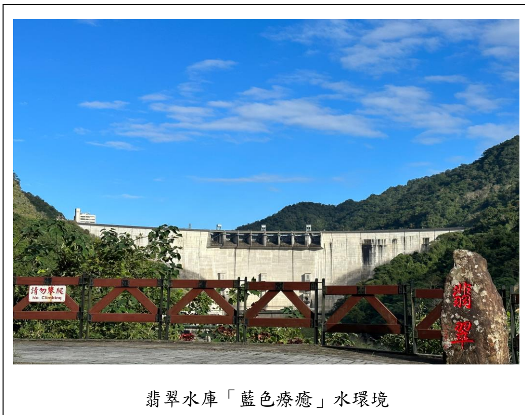
翡翠水庫「藍色療癒」水環境