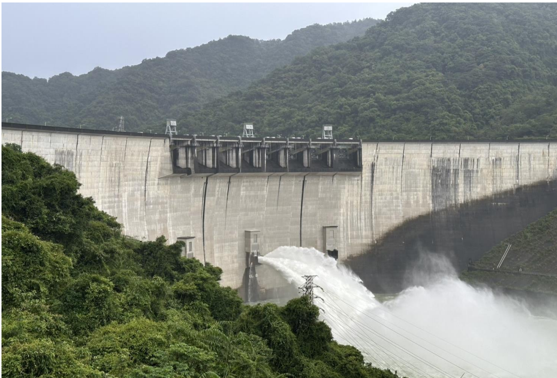
翡翠水庫預防性放水