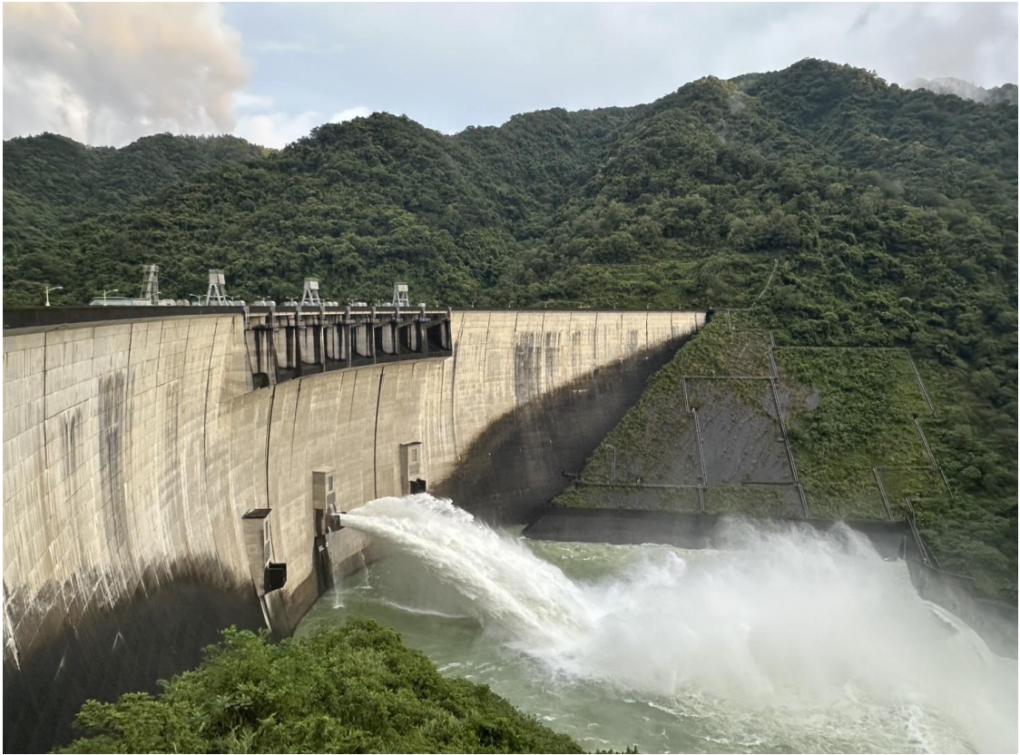
翡翠水庫預防性放水