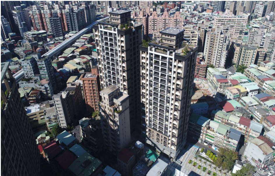
更新後大樓外觀照片