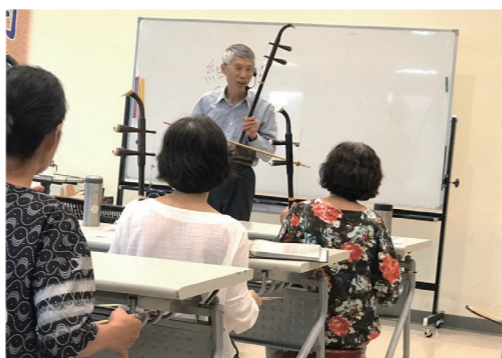
新竹東區樂齡學習中心的健身二胡課。

但是個人的力量還是有限，缺乏官方的媒介及企業參與，終究難以讓計畫延續。近 10 年來，玻璃樂器的熱潮已過，人們已對它漸漸淡忘，連玻璃工藝博物館都未能將這一批玻璃樂器做收藏，更遑論將玻璃樂器工藝提升到藝術的境界。低調隨緣的許詩羸老師，將這些功成身退的玻璃樂器靜擺於家中。這些曾經風光過的玻璃樂器，就像大起大落的人生，而人生的苦就在於執著，所以唯有選擇放下，才能離苦得樂，這也是許詩羸老師難能可貴的地方，做事盡心盡力的他，相信只要一切無愧於心，就是圓滿！