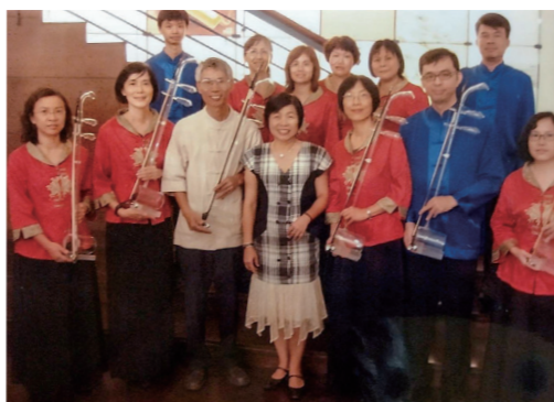
在交通大學浩然圖書館 B1 藝文空間「璃響生活 — 居家·創·綠點子」生活美學展，演奏環保創意玻璃胡琴。