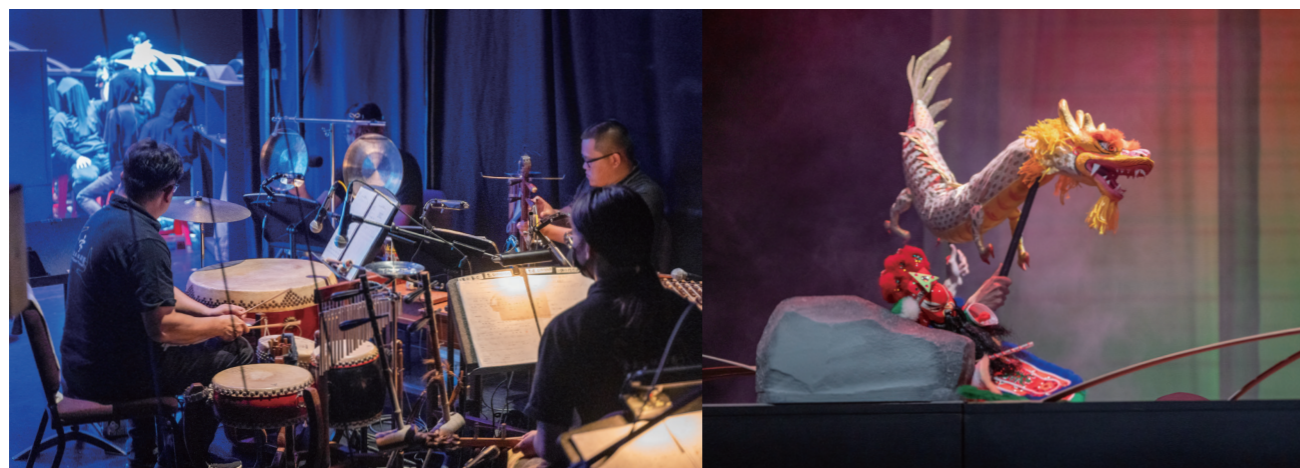
左：頭手鼓與操偶師天衣無縫的配合，襯托精彩打鬥場景。/ 右：〈玄郎收妖〉金龍武戲走起，展現古老的節奏張力。

「蒹葭蒼蒼，白露為霜。所謂伊人，在水一方。」幽幽的歌聲，緩緩而唱，道不盡人間的破碎感，隱藏在臺語文的韻腳裡，原來，是水鬼在唱歌。