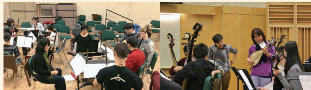
Members of the Wesleyan Chinese Music Ensemble played in small groups during regular class meetings