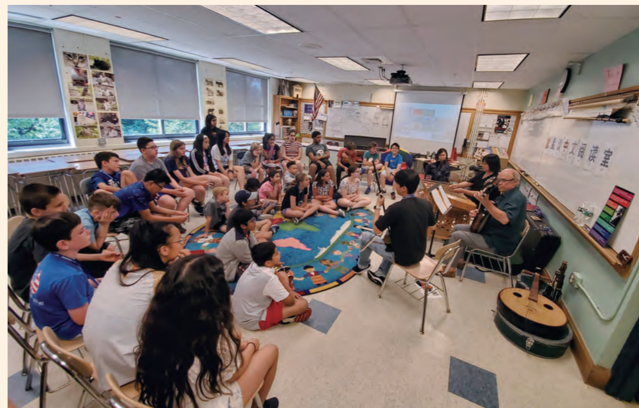
The Wesleyan Chinese Music Ensemble introduced Chinese music at a summer Mandarin Chinese camp in Connecticut in July 2019

Maintaining and repairing instruments poses another significant challenge. During the winter, indoor heating is often turned on in the northeastern U.S., which causes the instruments to be vulnerable to cracking. Furthermore, instruments are frequently damaged during transportation. Unfortunately, there aren't many Chinese instrument specialty stores in the eastern U.S., making it difficult to find someone to help with repairs or maintenance. Occasionally, we take damaged instruments to New York to seek assistance from professional musicians for repairs. I have also brought instruments back to Taiwan for repair on multiple occasions during winter and summer vacations. Some students have asked me why I treat the instruments as if they were precious treasures. I hope they can experience the hardships of maintaining and repairing instruments themselves and truly appreciate their value.