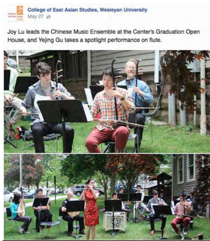
2014 年 5 月，在 Wesleyan 東亞研究所的臉書頁面上介紹了國樂團在畢業季表演的情况

國樂團也常與其他音樂形式合作，包括與猶太 Klezmer 樂團、日本太鼓樂團、韓國鼓樂團等一起演出。此外，Wesleyan 音樂系教授 I. M. Harjito 還為國樂器寫了 2 首樂曲，一首是 2009 年首演的 Gendhing Erhu （給二胡和爪哇甘美朗），另一首是 2017 年首演的 Mengimpi （給二胡、琵琶、笛子和爪哇甘美朗）。