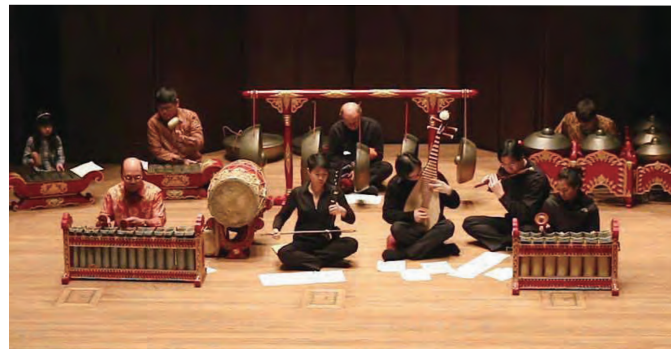
2017 年 2 月，寫給二胡、琵琶、笛子和瓜哇甘美朗的樂曲 Mengimpi 在 Wesleyan 大學首演

今年是我在美國指導國樂團的第十年（第 19 個學期），一切源於 2007 年的博士生時期。國立臺灣師範大學音樂學系主修二胡的我，畢業後曾在臺灣教音樂和帶領國樂團，後到英國 University of Sheffield 攻讀民族音樂學碩士學位。由於此一背景，在進入 Wesleyan University 讀博士時便擔任該校國樂團的助教，次年被聘為專任指導。到了 2020 年，又協助 Smith College 創立了國樂團。一路走來，有摸索、有挑戰、還有很多寶貴的經驗和收穫。本文將就個人經歷淺談國樂團在美國東岸大學中的發展，以及個人帶團所見所聞與感想。