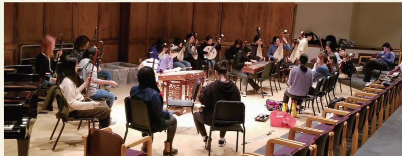
2020 年 2 月 4 日，Smith 大學國樂團第一次練習