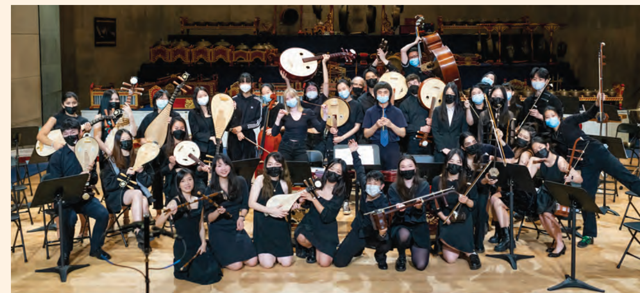
The Wesleyan Chinese Music Ensemble held their fall semester final performance in December 2022

On two cold winter nights in December 2022, Chinese music ensembles 1 from two universities on the East Coast of the United States each held their final concerts. The Wesleyan Chinese Music Ensemble, with 29 members, and the Smith College Chinese Music Ensemble, with 19 members, each performed eight pieces that lasted nearly an hour. The program featured a diverse range of performances, including full ensemble pieces, small ensemble performances, singing with the ensemble, solo instrumental pieces, and Peking opera singing. Members also introduced their instruments, adding an extra layer of depth to the performance. After the concert, I was touched to see some audience members express their gratitude, stating that it was their first time experiencing Chinese music up close in the U.S. Some Chinese-American students shared that they heard familiar sounds from their childhood, while some international students from Taiwan and China said they shed tears due to feelings of homesickness. It was a truly moving experience for all involved.