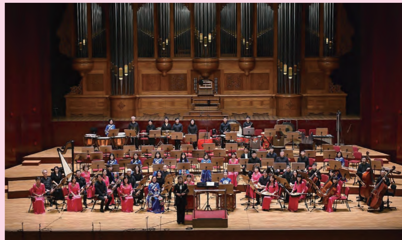
樂友國樂團演出合影

奏什麼，都給他協奏，我們這些老師都願意擔任伴奏。」多年以來，該團已培養了不少國樂人才，對於國樂師生而言，樂友國樂團無疑是能為他們提供藝術才華、延續音樂熱情，甚至進行跨世代交流的場所。