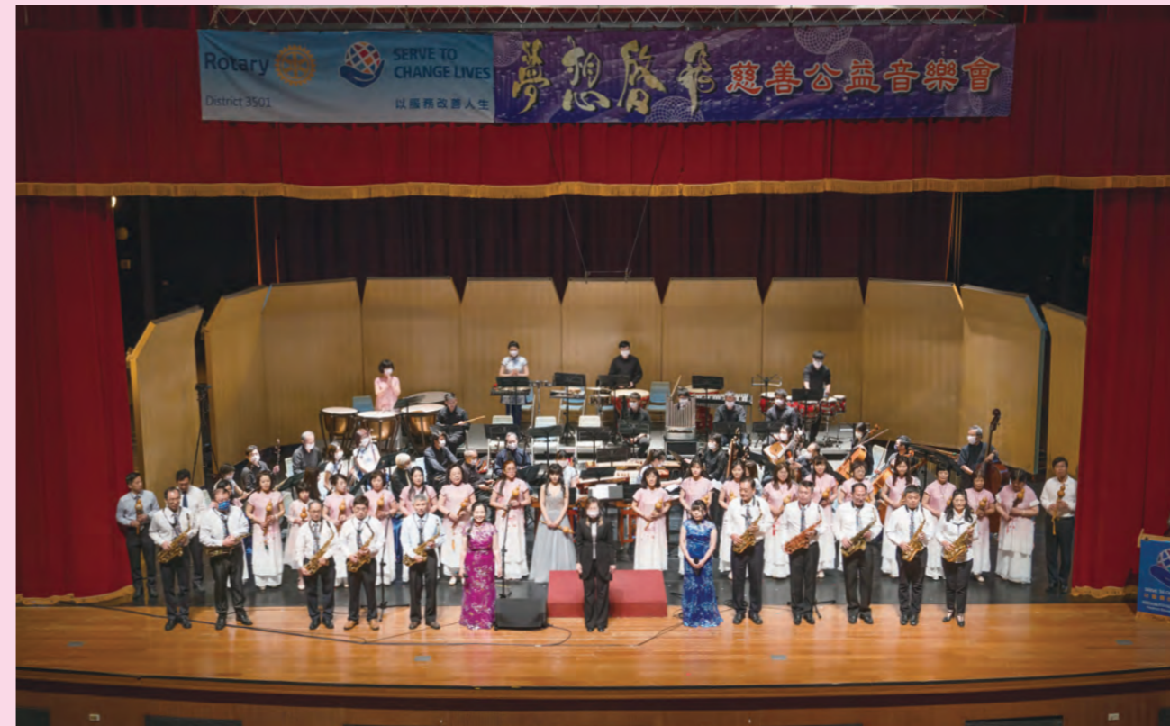
夢想啟飛音樂協會舉辦慈善公益音樂會

回到本文的核心問題：國樂如何實現終身學習？兩位老師的例子告訴我們，要熱烈地去愛音樂，並傳播這份愛。因為對音樂的熱愛，它才能成為生命中不可或缺的一部分，並且永遠激發參與的動力。兩位老師不僅以身作則，也將之看作國樂經營的核心理念，因而使國樂充滿生命力、並持續永續。