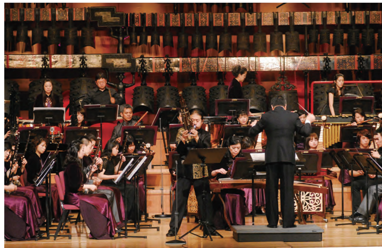
2010年5月29日笙演奏家吳巍與臺北市立國樂團共同演繹 SCHNEIDER 所創作的《土與火》

吳巍是活躍於國際主流舞臺的前衛笙演奏家，曾與不計其數的國際級一流樂團和指揮家合作演出，包括長野健與柏林愛樂樂團、鄭明勳與首爾愛樂樂團、杜達美與洛杉磯愛樂樂團、沃科夫與 BBC 交響樂團、艾索普與卡布里洛音樂節和聖保羅交響樂團、馬爾契與皇家斯德哥爾摩愛樂樂團和紐約愛樂樂團、梵志登和迪華特與荷蘭廣播愛樂樂團等等，並經常受邀參與國際音樂節，諸如倫敦的 BBC 逍遙音樂節、巴黎秋季藝術節、多惱爾與根音樂節、愛丁堡國際藝術節、東京三得利音樂廳夏季音樂節、德勒斯登音樂節、紐約林肯中心藝術節等等。