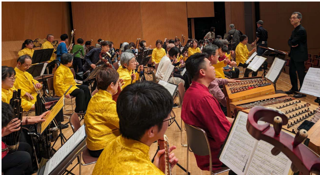
最後的大合奏彩排，由天翔樂團指揮——井上康夫帶領下來參與的演奏者排練《將軍令》

除了二胡樂團的演出之外，還有葫蘆絲樂團、古箏樂團、小型絲竹室內樂、小型國樂團、崑曲、賦詩等，這些在臺灣幾乎不會在同一個場子出現的演出，因為中國音樂嘉年華同時匯聚在大阪的演奏廳，即便是拉奏二胡的人，與其他樂器、樂種的人都可以交流，比起二胡或樂器演奏的技術，大家更重視的似乎是對於相同聲音文化的喜愛，或是一起爲了同樣的樂器、樂曲努力共同奮鬥的感覺。二胡在臺灣除了在國樂團或少數的弓弦樂團之外，可以說原本就是一項獨奏樂器，但現今在日本，除了獨奏樂器，在業餘愛好者人士間已經作爲一種「二胡的共同體」的體現，除了是共同愛好二胡音聲者聚集的成果，也是形塑團體認同感、歸屬感的重要皈依。