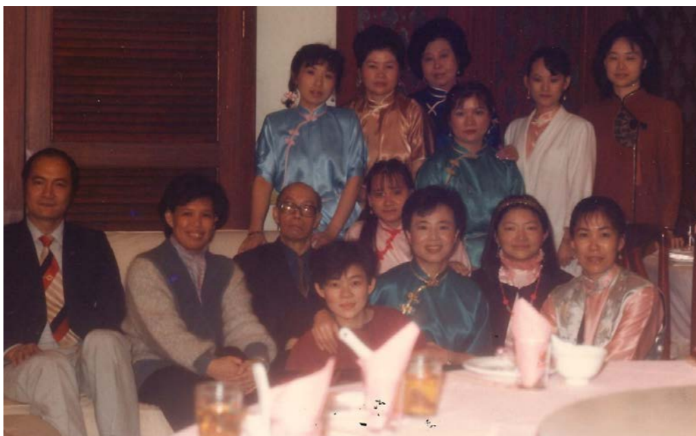
音樂會後師生歡宴，筆者位於左1