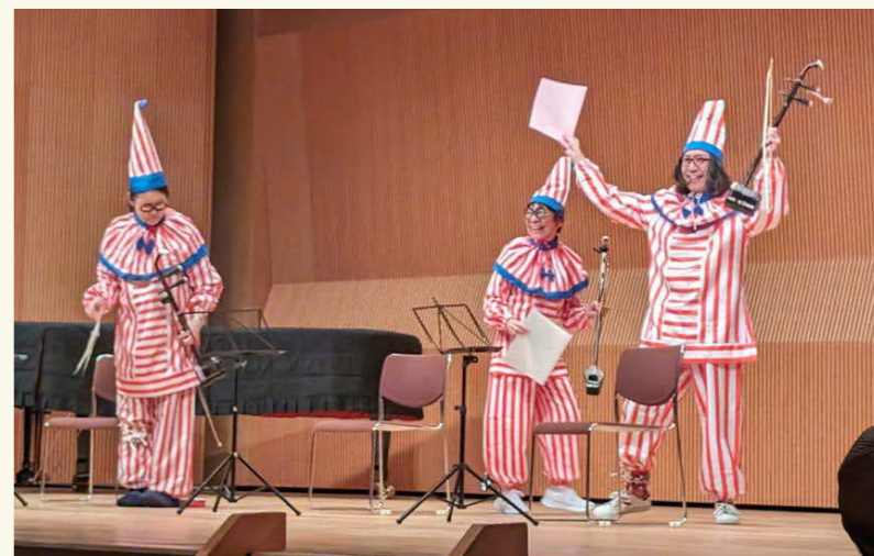
來自東京的「担担麵」在2025年中國音樂嘉年華初次登場，3名團員皆演奏二胡並扮成大阪有名的「食倒太郎」，結合帶動唱與劇場，帶給大家歡樂

二胡樂團佔多數，但因為每個團的曲目跟風格走向不同，整體來說不會太單一化。像是鳴尾牧子的樂團，演出的時候還有團員戴假髮、拿小道具對著觀眾帶動唱，整個舞臺跟臺下的氣氛變得非常熱絡。另外還有初次登場，來自東京的「担担麵」，他們把自己打扮成大阪的「食倒太郎」的模樣，手腳繫上鈴鐺，三個人從登臺開始就手舞足蹈，並且在舞臺上呈現小劇場，已經跳脫了音樂會常態的嚴謹又慎重的感覺，這些團體雖然手中拿著二胡，但他們其實是以二胡作為媒介，展現了他們各自獨特的演奏風格。