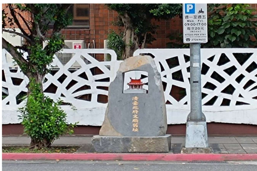
照片說明：新立「清臺北府文廟舊址」碑照片