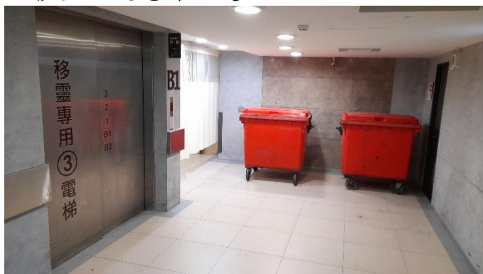
B1移靈三號電梯口處