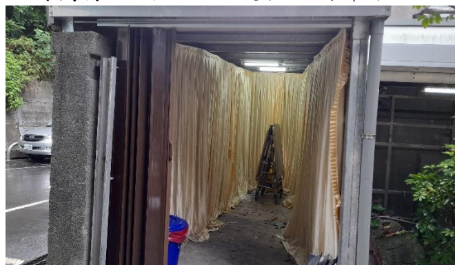
臨時簡易入殮區、防護衣配備卸除區