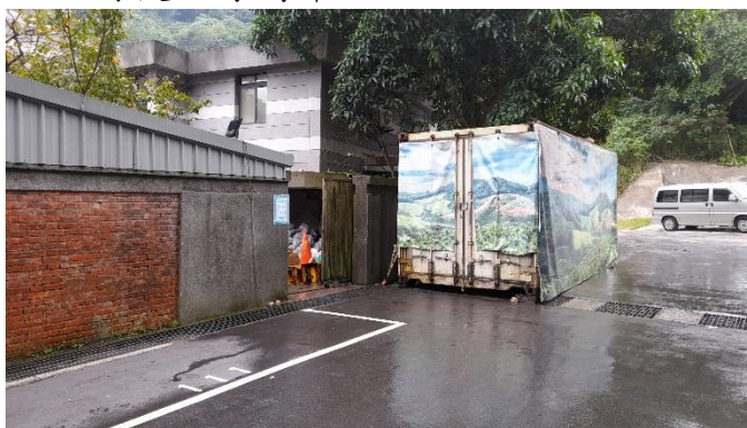
火化場後方專屬車位