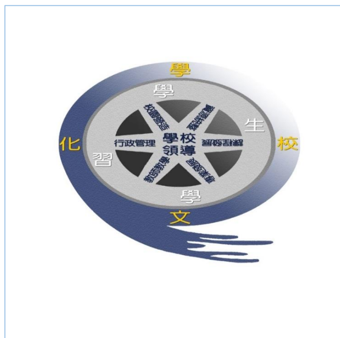
圖 3 優質學校 2.0—飛輪模式

系統模式實施一段時間之後，認為宜稍作微調，使其更具動態性，以符合實際需求，其中將校長領導修正為學校領導，其他向度繼續維持，惟此模式是以學校領導為核心（第一圈），帶動行政管理、課程發展、教師教學、專業發展、資源統整、校園營造（第二圈），幫助學生學習（第三圈），擴散及整個學校文化（第四圈），並持續發展，形成一個飛輪狀態，乃將優質學校 2.0 稱為飛輪模式。如圖 3 所示。