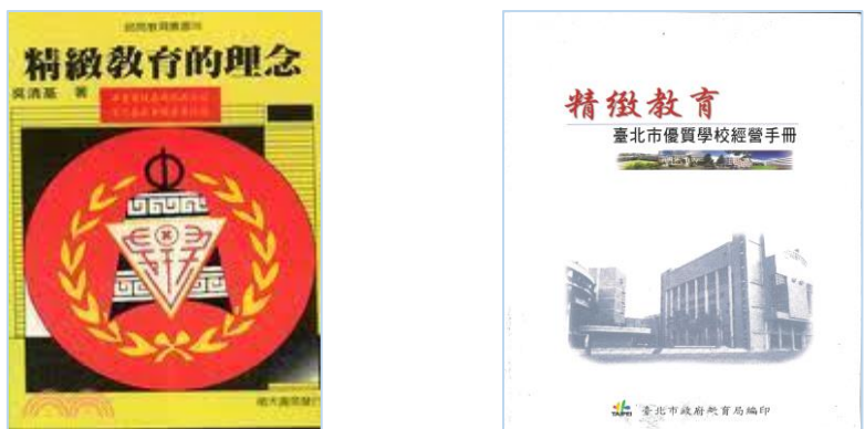
圖 1 《精緻教育的理念》專書和《臺北市優質學校經營手冊》