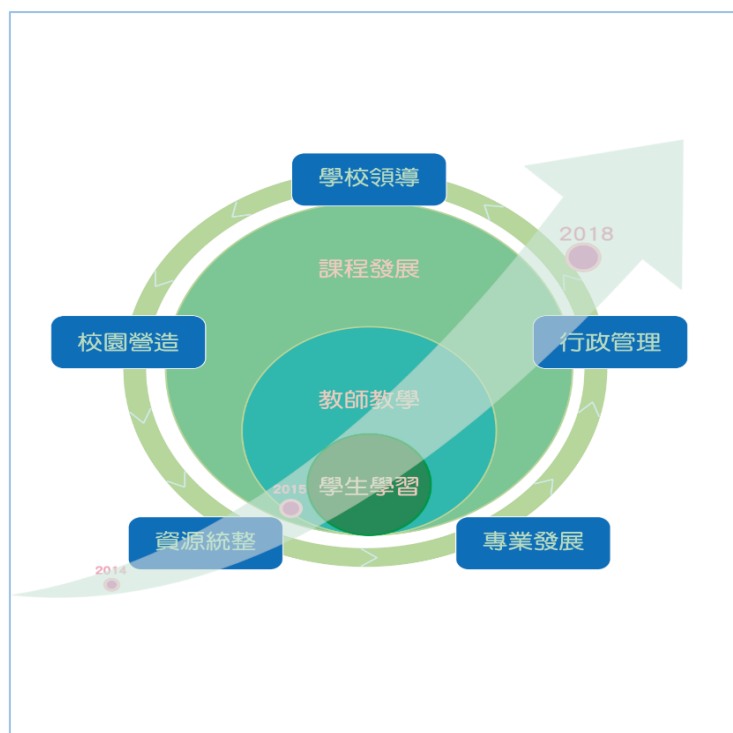
圖 4 優質學校 3.0—學習者模式