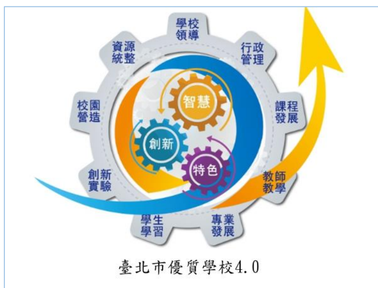
圖 5 優質學校 4.0—創新模式

優質學校實施十多年之後，適逢實驗教育如火如荼推動，臺北市亦推出各種創新教育作為，為符應此一政策重點，乃進行優質學校指標滾動式修正，確立以創新、智慧、特色為核心，並增加創新實驗向度，將各向度指標融入一些創新元素，凸顯本次調整之特色，在原來的八大向度，增加創新實驗向度，因而將優質學校 4.0 稱為創新模式，如圖 5 所示。