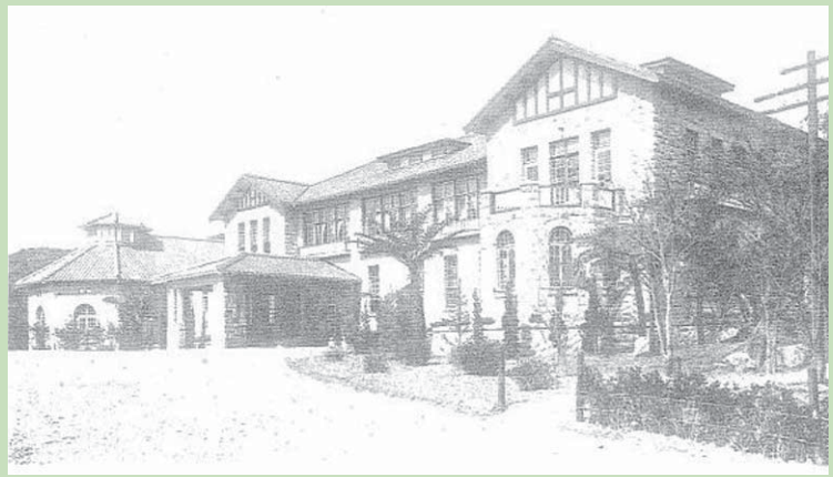
▲草山公共浴場(正面全景-臺灣建築會誌) 現為臺北市教師研習中心