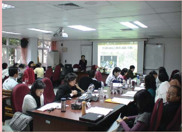
▲► 96.11.29 96性別平等教育課程領導實務專修研習

我得像個熟悉各種布料織工的專家一樣，必須熟知各種生命紋理，以便能夠依據每個人的記憶，重新把零碎或破損的生命，按照他們原來的紋理編織回去。我常說裁縫師的針線縫補的是衣物的破損，心理師的專業療癒的是生命的傷口，都必須按照舊有的紋理，不著痕跡的修補還原。