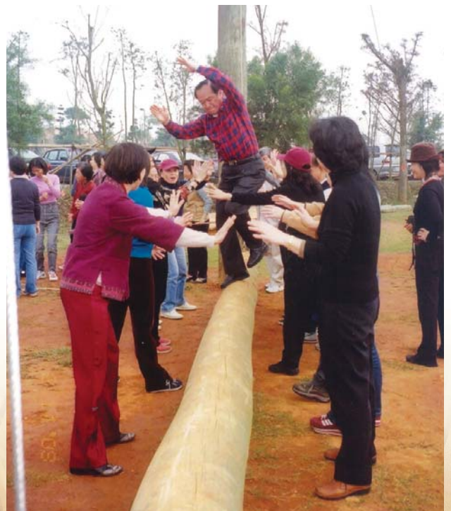
▲▶ 92. 2. 14 綜合活動領域(於龍潭渴望園區辦理)