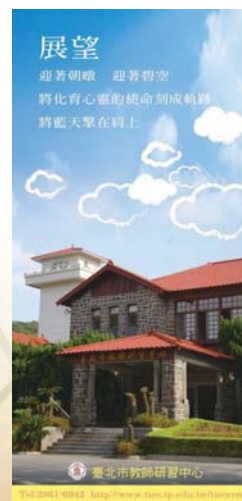
▲教師諮詢文宣(藏書票)