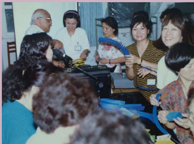
▲紙藝教材教法研習實作

動，覺得中心工作同仁極為親切。臺北市教研中心，在教育局的大力支持，歷任中心主任及同仁的通力合作下，研習科目、活動內容與成效可說居全國之冠，這種成就將會繼續保持下去，欣逢臺北市教師研習中心成立30週年，特此祝賀。