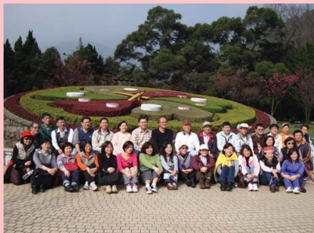
▲99. 1. 30 薦任九職等以上研習花鐘合影