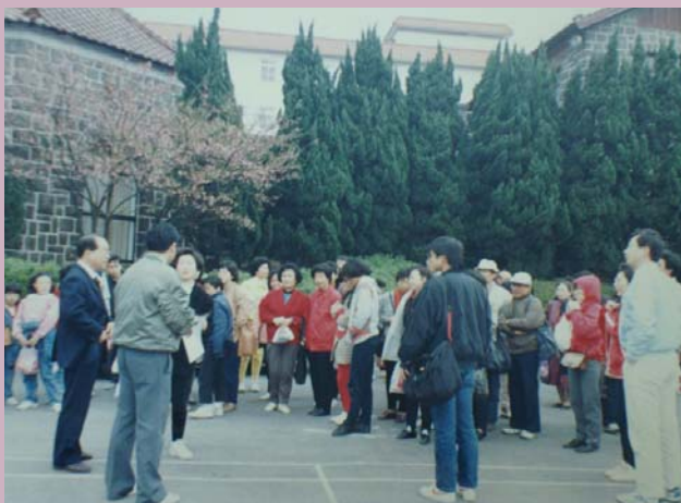
▲79.6.7 陽明山賞花教師聯誼活動