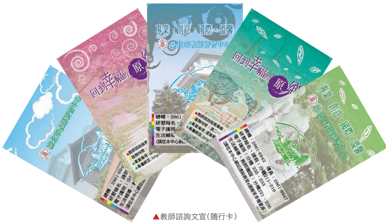
▲教師諮詢文宣(隨行卡)

動，覺得中心工作同仁極為親切。臺北市教研中心，在教育局的大力支持，歷任中心主任及同仁的通力合作下，研習科目、活動內容與成效可說居全國之冠，這種成就將會繼續保持下去，欣逢臺北市教師研習中心成立30週年，特此祝賀。