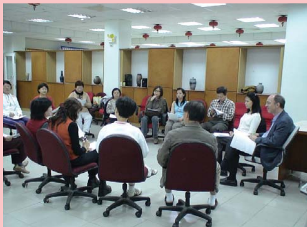
▲▶ 96. 11. 13 96年度教師壓力調適－雅肯靜坐專修研習