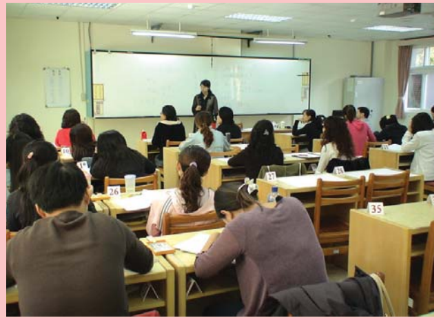
▲▶ 96. 10. 27 96年度初任導師精進班級經營能力專修研習

佛教用語習稱為「觀照」（創古仁波切，民90）。布袋和尚師云：「手把青秧插滿田，低頭便見水中天，心地清靜方為到，退後原來是向前。」意思是要破除一般人的慣性思維，轉換固著的自我狀態，而能打開視野，產生心理位移的效果。俗話說：「山不轉路轉，路不轉人轉，人不轉心轉」或「退一步海闊天空、忍一時風平浪靜」、「山窮水盡柳暗花明」、「全局思維顧全大局」、「塞翁失馬焉知非福」、「當局者迷、旁觀者清」、「吃虧就是佔便宜」、「吃苦當作吃補」、「打斷手骨更強壯」等都是心理位移的現象。