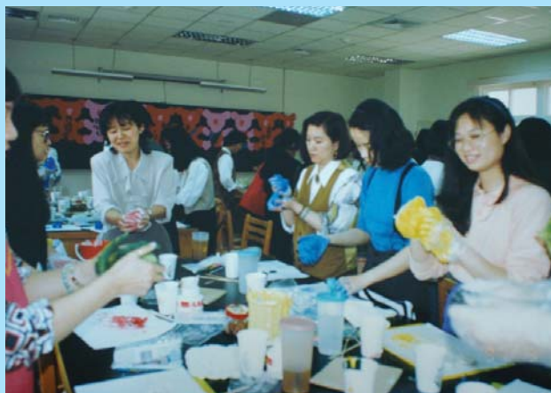
▲▶ 86年幼稚園教具研習