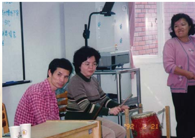
▲ 90.11.07 河洛語教學進階成果發表