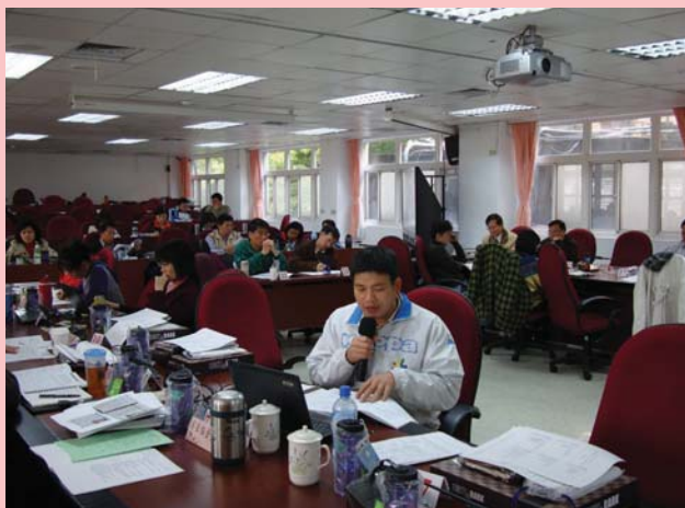
▲99. 1. 29 薦任九職等以上研習提問情形