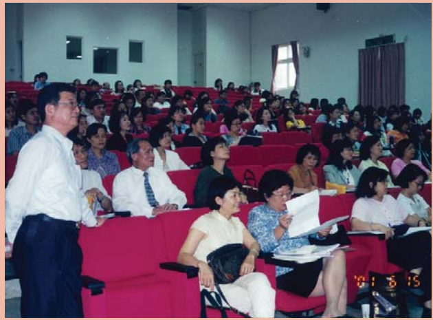
▲▶90.6 九年一貫學校本位種子教師研習

方式。據於「三個臭皮匠勝過一個諸葛亮」的原理，此項「問題與討論」的過程能給提問者及大家意想不到的正向協助。