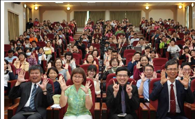
與會學員全體合影