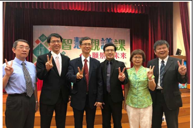
講座嘉賓合影留念