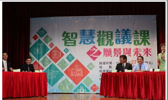
專家學者進行主題論壇