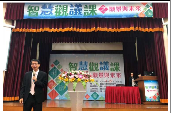
黃旭鈞教授進行專題演講