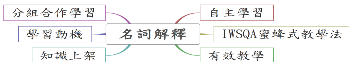
圖 1-2 名詞解釋