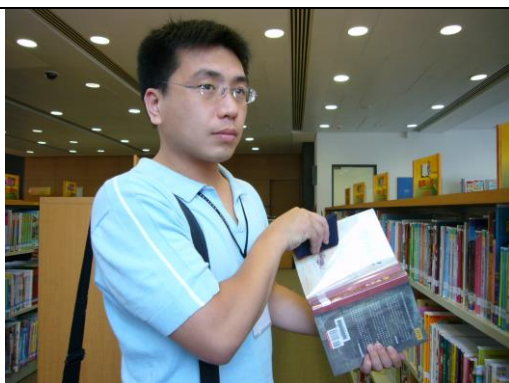
除期刊外，書籍全部加上一層透明保護套(Book Protectors)