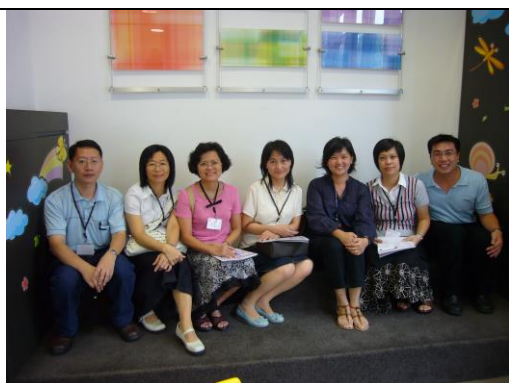
「活動式」空間隔牆，平時敞開（參訪團員與赤柱公共圖書館館長合影）