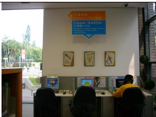
配置兒童專屬檢索區及檢索設備