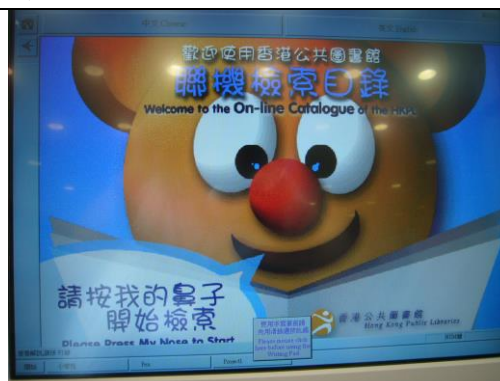
兒童聯機公眾檢索目錄畫面生動，並提供 touch screen 螢幕觸控功能