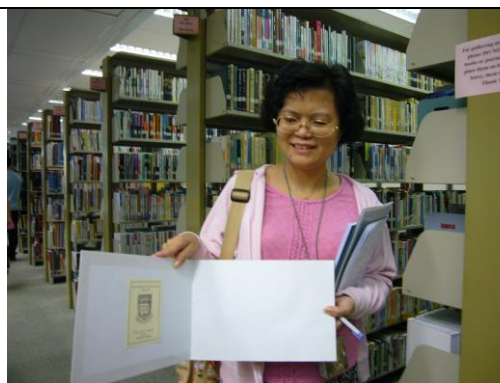
平裝書皮經改裝成精裝，在公共圖書館如此，在香港大學亦是如此