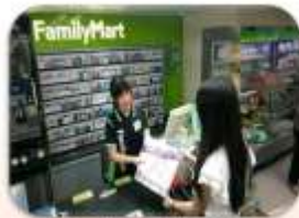
Users can pick up books they have reserved online at a convenience store.