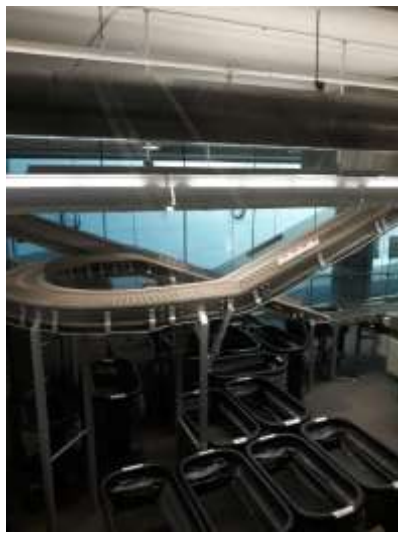
左：溫哥華公共圖書館總館圖書自動分揀系統。