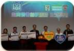
The ceremony to launch the convenience store book loan service on Oct. 17, 2016.