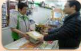
After users package the returned books, operate the self-help machine and pay at the counter, the books can be shipped back to the library.