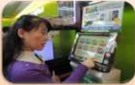
Users go to the self-help machine in a convenience store and click on returned book delivering.