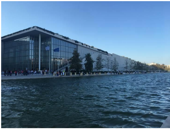
參觀希臘國家圖書館