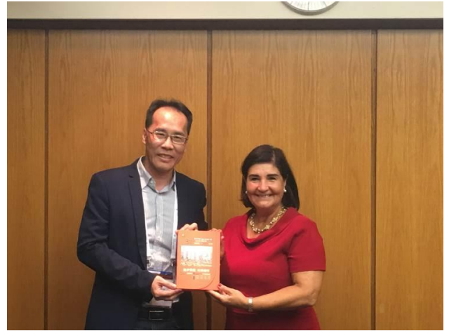
館長致贈臺北市2018年鑑給IFLA會長