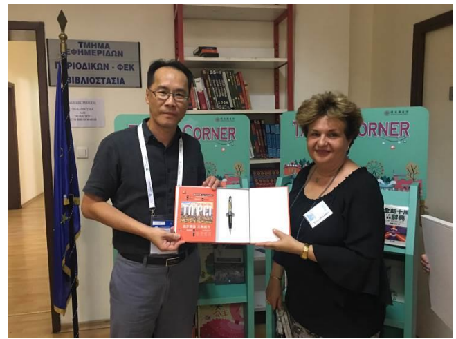
館長致贈臺北市2018年鑑給雅典市圖