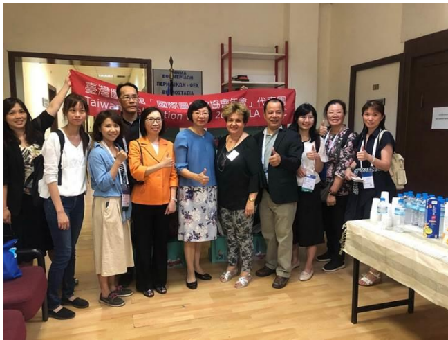
參加海外第一個「Taiwan Corner」贈書儀式