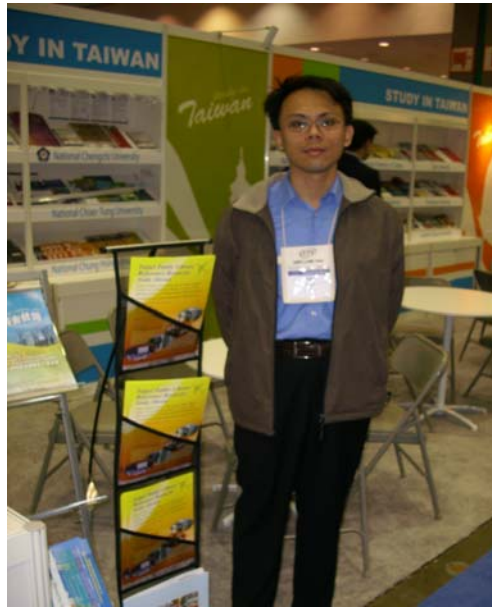
(圖為 2009 年 NAFAA 大會場，本館在臺灣留學攤位的介紹展示架)