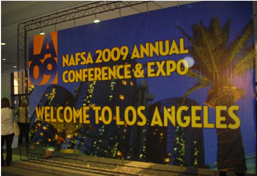
(NAFSA:National Association of International Educators，圖為 2009 年之大會場)