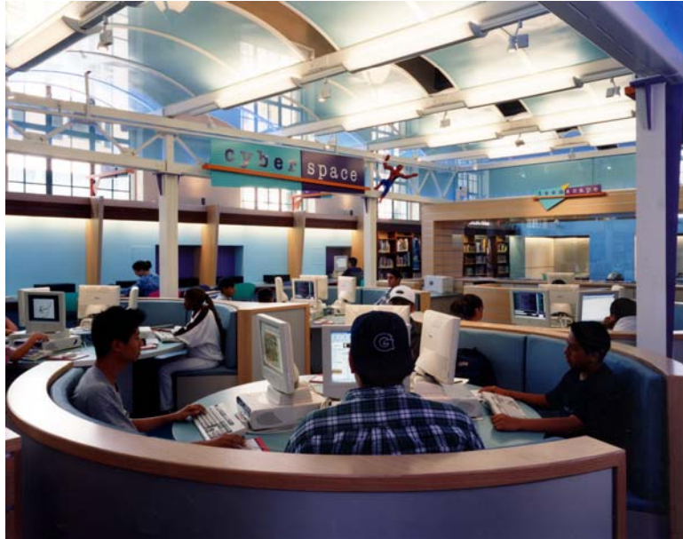
(圖為洛杉磯公共圖書館的青少年專屬空間 Teen' Scape)

除了 600 萬冊的實體圖書館藏外，洛杉磯公共圖書館還擁有 200 萬張攝影作品的館藏，其中 70% 已經數位化並有相關的詮釋資料 (metadata) 製作。