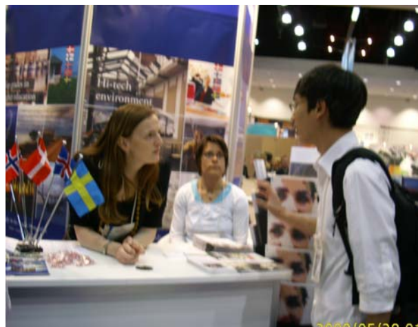
(圖為本館繁課長與北歐留學攤位的人員介紹本館留學資料中心並蒐集北歐留學資訊)