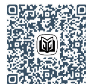
掃碼閱讀線上版本