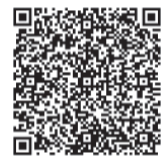
(掃碼閱讀詳細資訊)

此外，凡 108 年 7 月 1 日起新辦個人借閱證且開通台北通者，便可於次月月初獲得 300 點，一生一次機會千萬不要錯過。喜愛借書者或上個月新辦證者，不妨上「閱讀存摺」挖寶。