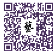
更多藝文活動資訊請參考