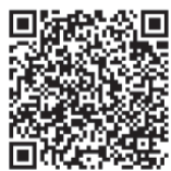
(快來報名小小館員體驗活動)