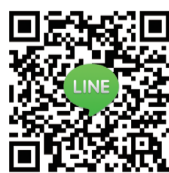
與本館 Line@ 加入好友