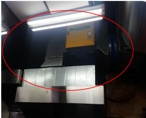
改善後(裝設靜電式油煙處理設備)