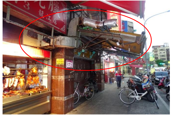
改善前(簡易防制設備)