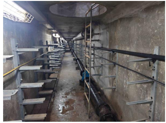
全區共同管道-道路工程