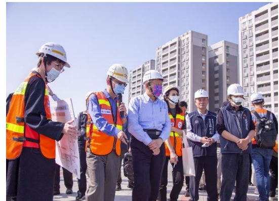
市長視察北科現況