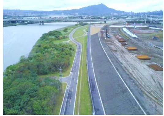
洲美超級堤防-堤防工程