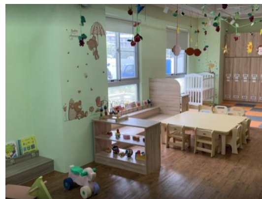
專案住宅及支援性服務設施