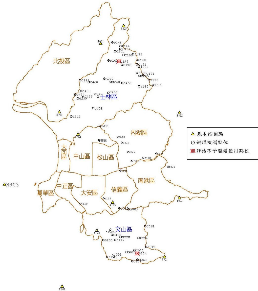
圖 1 加密控制點分布圖