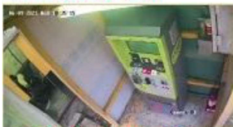
1-1 繳費機 (西)