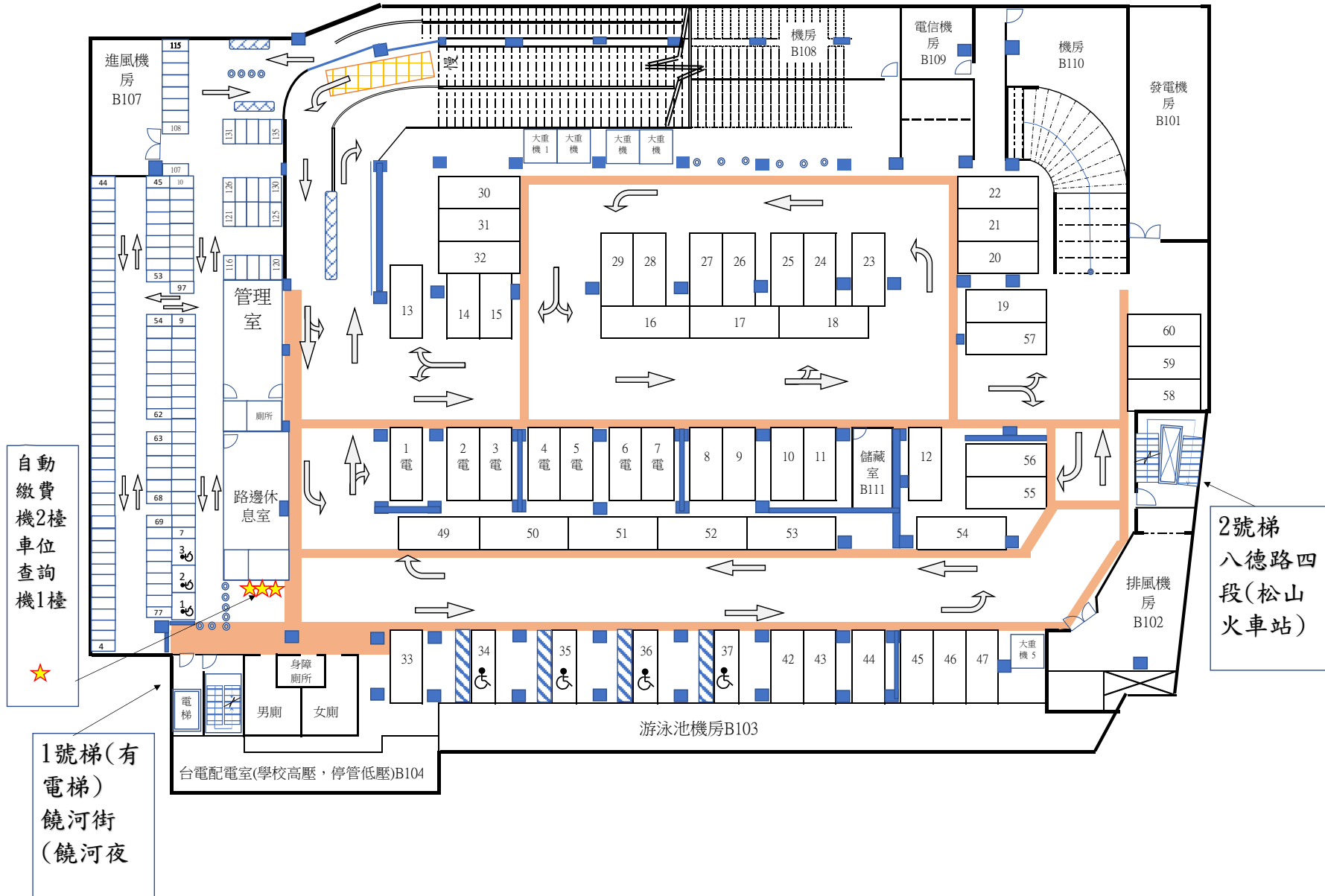
松山國小地下停車場地下第1層現況示意圖