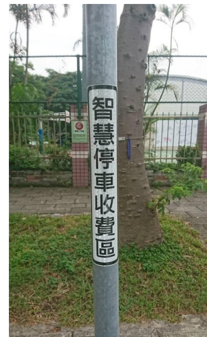
收費桿件 張貼辨識貼紙

推廣智慧停車，智慧停車收費區停車前10分鐘免費，108年底前使用手機智慧支付再享9折優惠