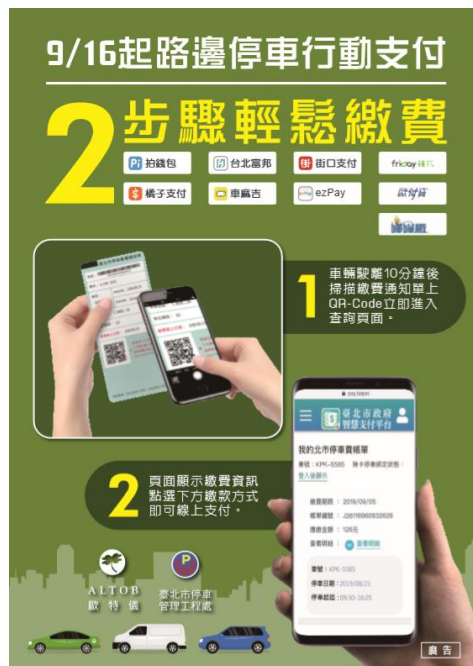
現場夾單宣導 (正面)