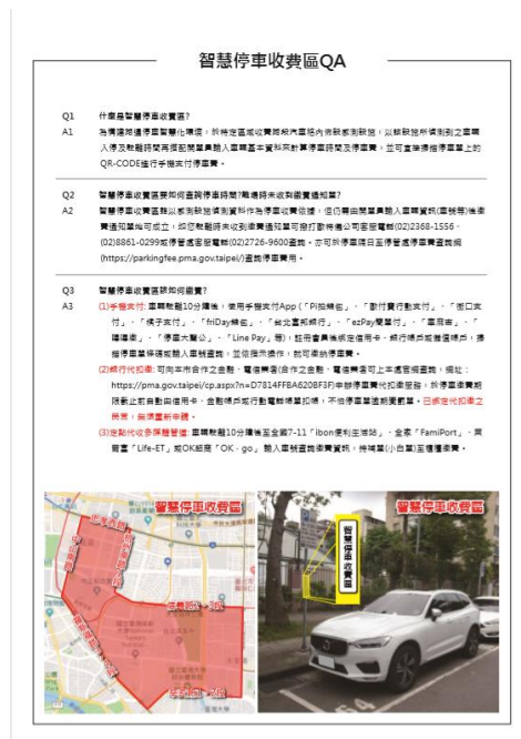
現場夾單宣導 (反面)