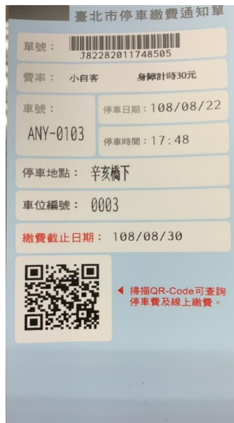
智慧化停車 繳費通知單