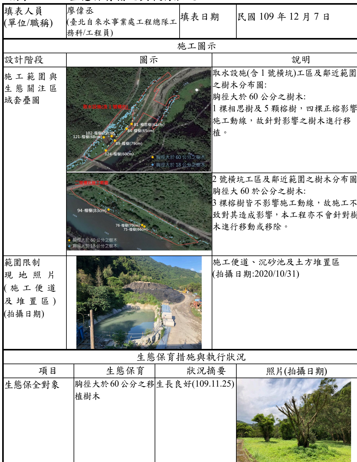
附表 C-06 生態保育措施與執行狀況