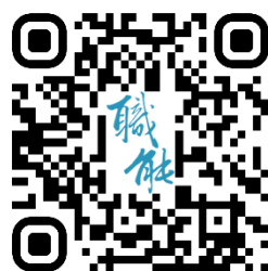
臺北市職能發展學院 官網