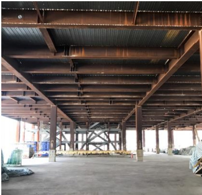
107 年 8 月 13 日影城棟施作情形