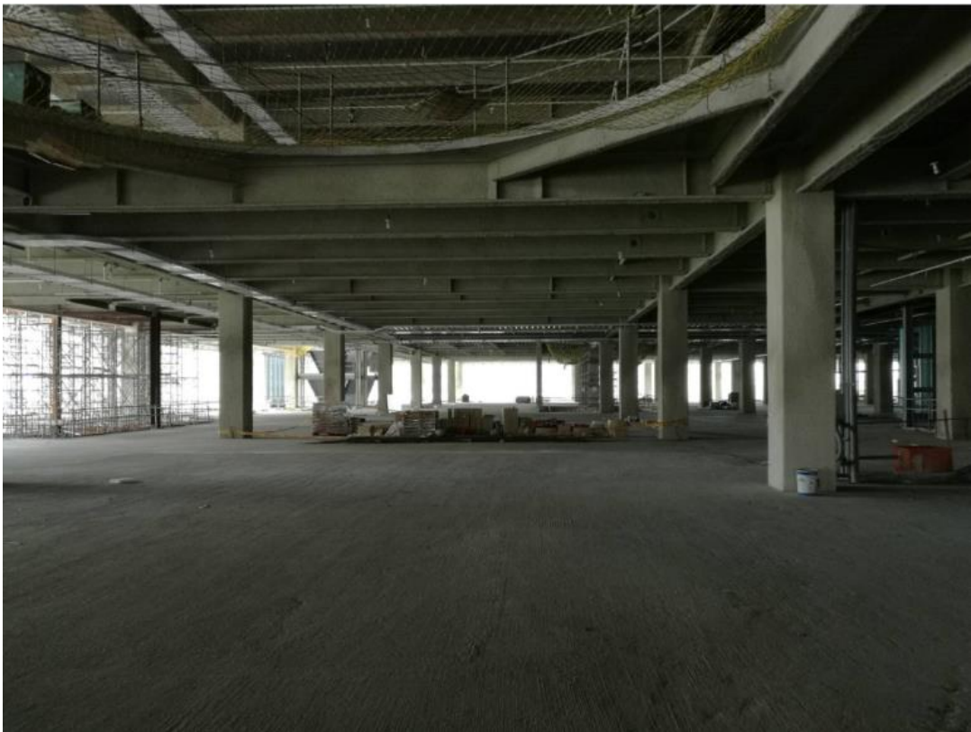
107年8月13日商場棟施作情形