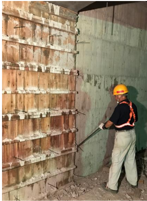
107年8月13日坍塌安全維護施作情形