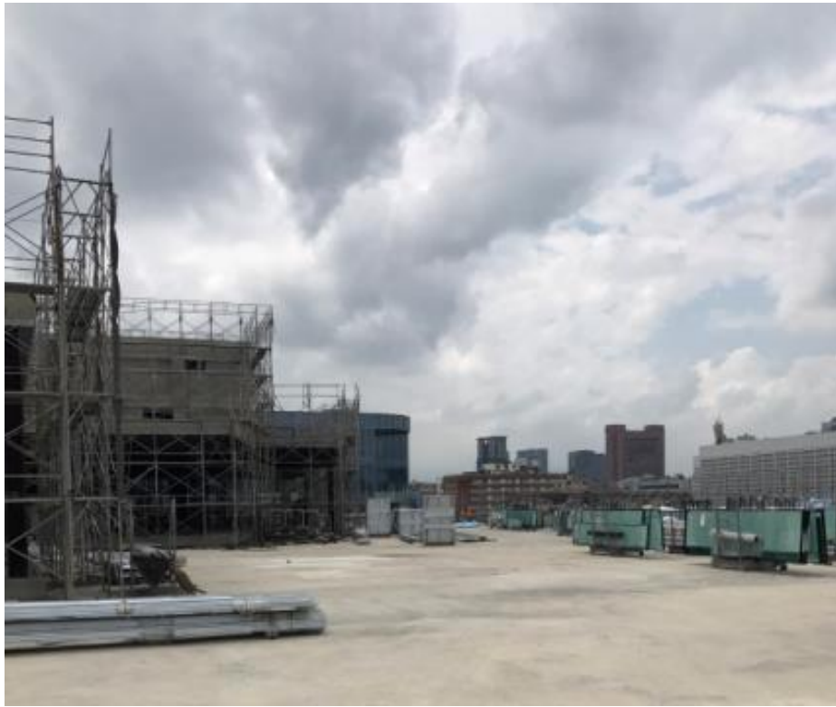
107 年 8 月 13 日影城棟施作情形