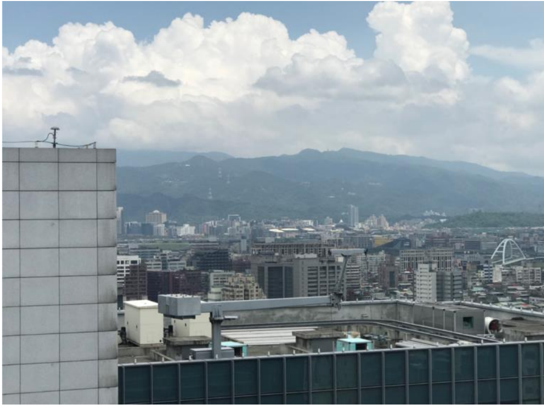
107年8月13日旅館棟施作情形