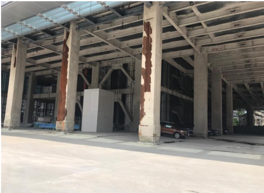
107年8月13日辦公棟施作情形