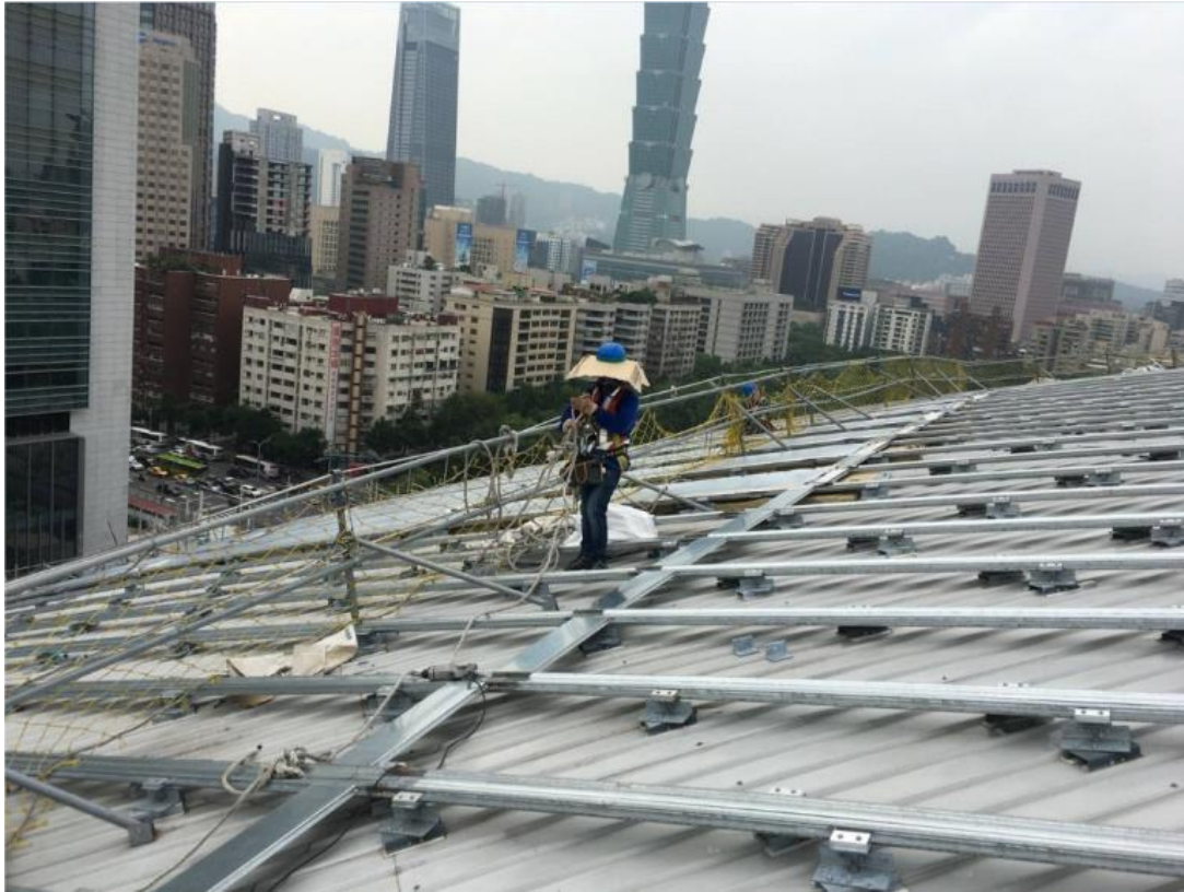
107年8月13日鏽蝕安全維護施作情形