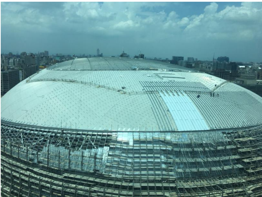
107年8月13日大巨蛋巨蛋棟施作情形