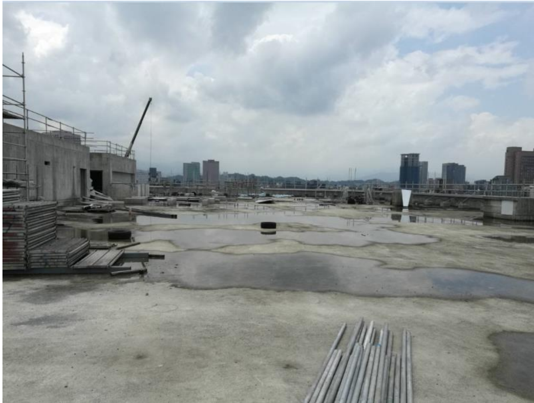
107年8月13日商場棟施作情形