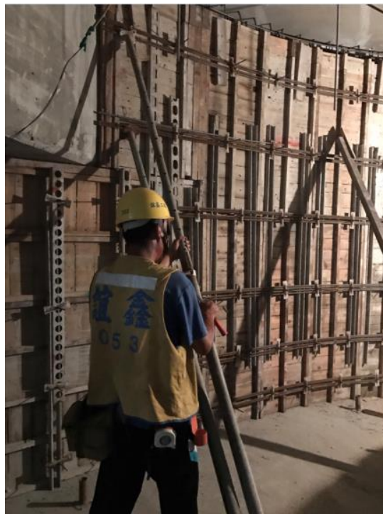
107年8月13日坍塌安全維護施作情形