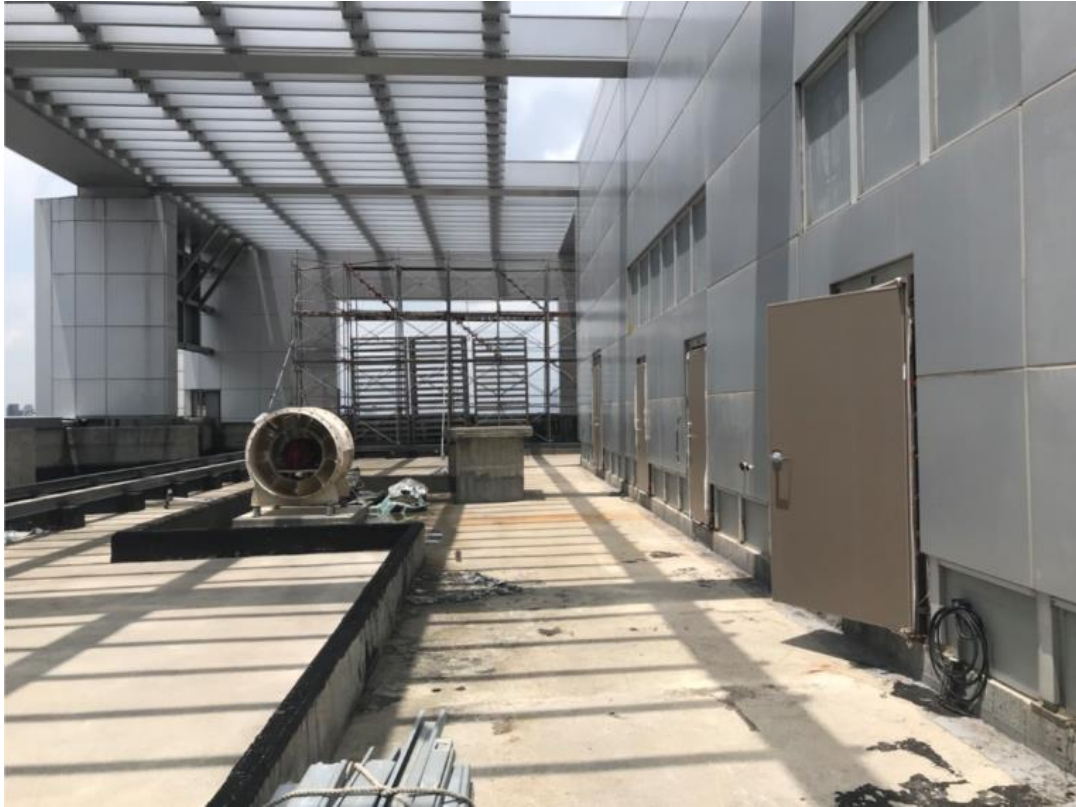
107年8月13日辦公棟施作情形