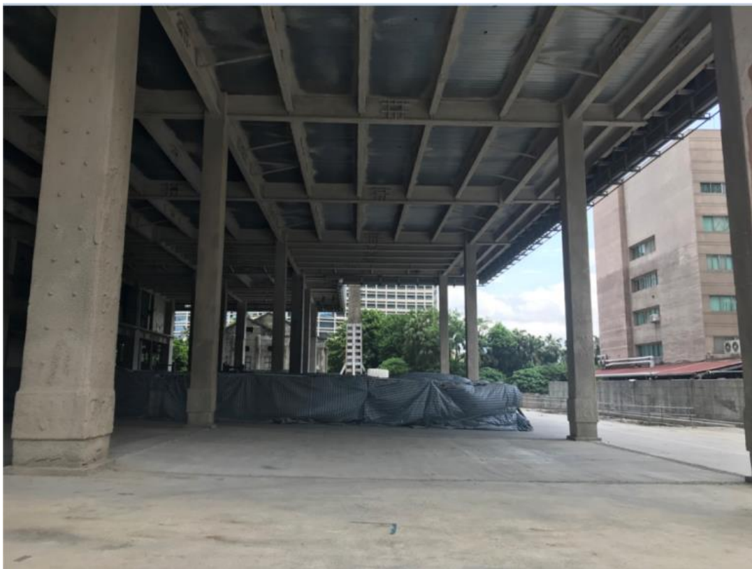
107年8月13日旅館棟施作情形