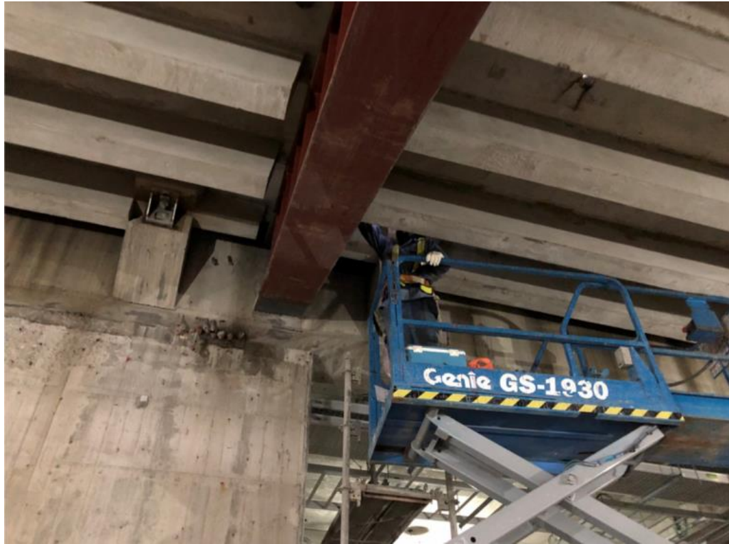
107年8月13日載重及水浮力安全維護施作情形