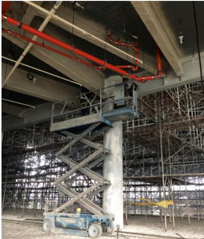
107年8月13日鏽蝕安全維護施作情形