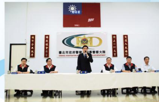
■郝市長與警察局長主持偵破臺企銀運鈔車強盜案記者會

犯罪偵查運用同心圓與打水漂理論，使以往遇瓶頸無法突破之刑案露出曙光。以101年3月發生之松山區臺灣中小企銀強盜案為例，專案小組成員運用監視器與上述理論，不到2個月即逮捕「雨衣大盜」，同時偵破94年與96年發生之2件銀行強盜案。