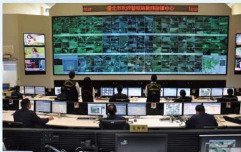
■警察局勤務指揮中心電視牆輪播12個行政區監視器即時影像

郝市長龍斌於96年治安會報指示—建置新錄影監視系統，警察局規劃設置1萬3,699支監視器（即第1期），於98年7月動工。在本府相關局、處戮力合作下，順利於101年11月完工，102年3月7日驗收合格。另該局於100年5月全力推動運用，除發揮良好之犯罪偵防效能外，在治安要點、道路車流監控及為民服務等各面向，均呈現出相當好的成效。