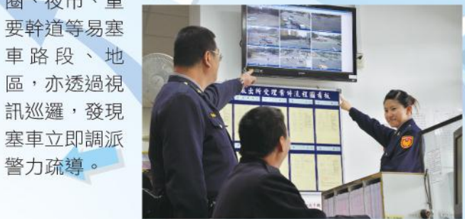
■武昌與介壽派出所執行視訊巡邏