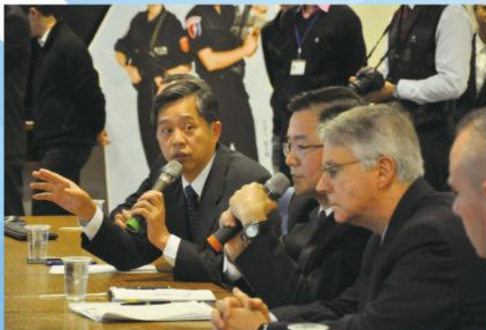
■紐約市警察局皮尼諾副局長（右1）

民國（以下略）101年元月以來，許多國際警政首長陸續參訪臺北市政府警察局（以下稱警察局）聽取新錄影監視系統（CCTV）簡報，其中多明尼加總統府部蒙塔佛（Gustavo Montalvo）部長基於該國改善治安需求，透過外交部期盼移植臺北經驗；紐約市警察局首席副局長皮尼諾（Rafael Pineiro）副局長則請警政署索取本局應用CCTV偵查資料，攜回參考。