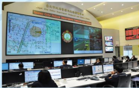
■警察局110結合GIS地圖實施勤務指揮管制作業

臺北市新錄影監視系統之規劃基於犯罪偵防需求，導入同心圓追蹤理論為核心概念，舉凡監視器設置地點、攝向及功能等皆依循「點、線、面」原則設計。於任一派出所及交通分隊等外勤單位之工作站，皆能隨時調閱1萬3699支監視器中任何1支之即時與歷史影像，解決以往警方需四處奔波調閱之缺點—建立「影像一站取、偵查更有力」的科技辦案新模式。