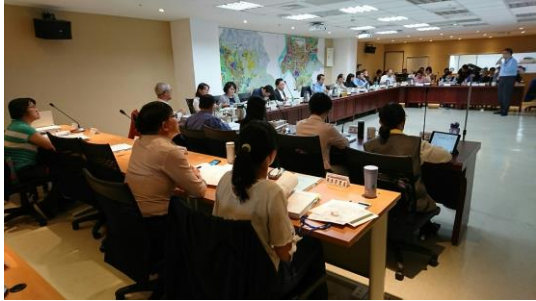
▲ 委員會議開會情形（申請單位簡報）