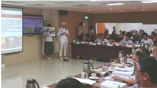
▲ 委員會議開會情形（民眾進場發言）