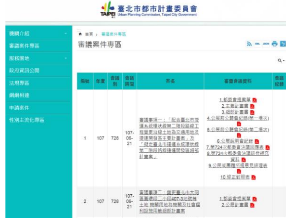
▲本會網站(審議案件專區)