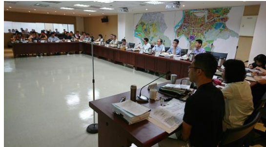
▲ 委員會議開會情形(委員討論)