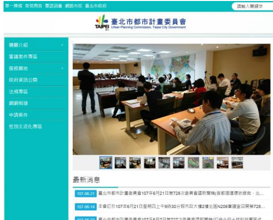
▲本會網站(最新消息)

開後 8 日內公告於機關網頁為努力目標，期望讓民眾能透過網際網路，即可獲得完整的都市計畫審議資訊服務。