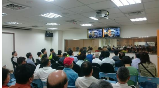
▲ 委員會議開會情形(民眾旁聽室旁聽)